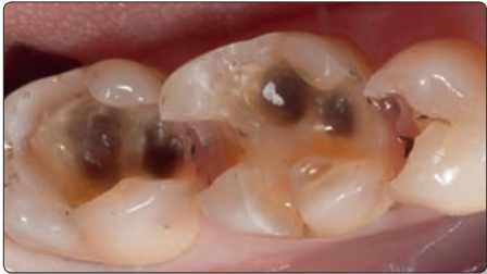
Les formes de préparations des restaurations postérieures