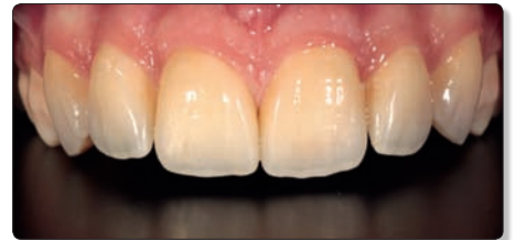
L'analyse du résultat final