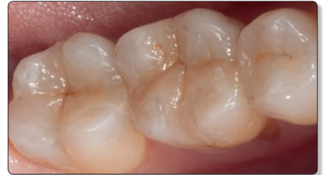
Le résultat final