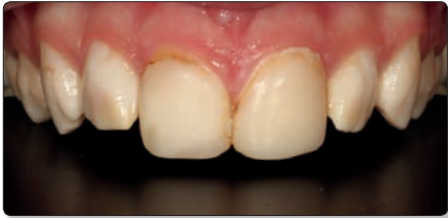
La situation clinique initiale