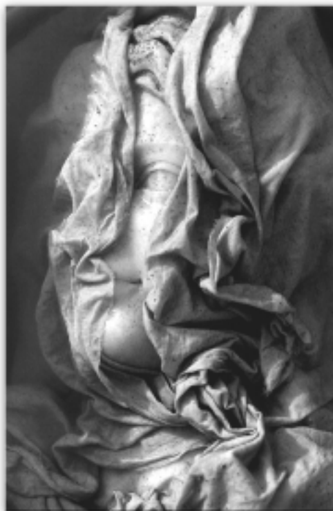
אפרודיטה, טורקיה 1975 "הראייה המסורתית את הנשים מבקשת לכסות את גופן"

האון הפרימיטיבי – ספורט, מין – ומשפילה את אלה שרמות הטסטוסטרון שלהם נשפוטות כנמוכות מן הנחוץ. החוכמה הרשמית, כמו גם חוכמת הרחוב, מצהירה שכדי להיות 'גבר אמיתי' נחוצים תחרותיות עזה ותוקפנות בכל תחום גברי קולקטיבי, וגם גישה מתירנית, ציידית, של "תפוס כפי יכולתך" כלפי נשים.