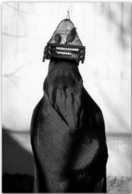
תומס אבקרמבי, "אישה עם ציפור בכלוב", קבול, אפגניסטן 1967

(טקטיקה דומה ננקטה על ידי נשים מוסלמיות רבות, המוצאות עצמן בעמדה מקבילה לזו שלנו). זהו, אם כן, הסבר מושך לשיח הצניעות הגואה בעולם האורתודוקסי, הסבר המשתלב עם ערכי צניעות מסורתיים, כגון ענוותנותו של עם ישראל שנבחר לקבל את התורה, ענוותנותו של הר סיני עצמו שזכה שעליו תינתן התורה וכדומה.