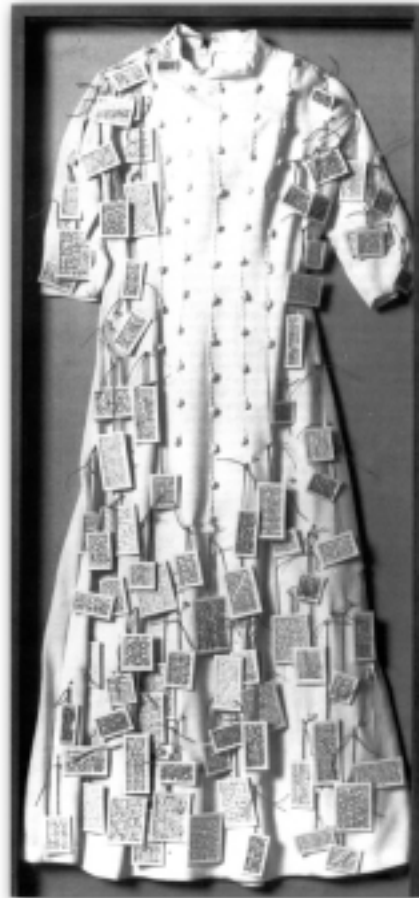
אנט מסא'ה, ההיסטוריה של השמלות 1990

עליהן, הן היו לובשות כולן בדי יוטה. במחקרים חדשים על חינוך לחיי משפחה מדווחים המורים שוב ושוב על כך שהם מלמדים את הבנות, באופן ברור ביותר, שבהן תלוי הדבר לדאוג שהבנים שאיתן בבני-עקיבא לא יחטאו.