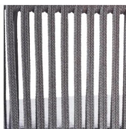
Soft rope (ROG)