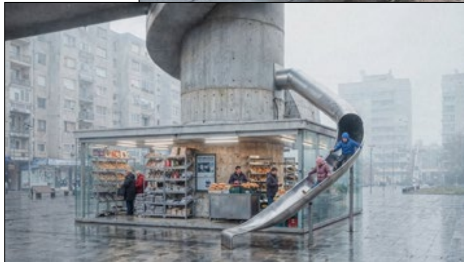
Casapack ha immaginato questa edicola del futuro ispirandosi a Fagetich Architecture

Perché Felicori: Il progetto Fagetich Architecture riscopre opere "minori", radicali e brutaliste del XX secolo, spesso caratterizzate da geometrie audaci e sperimentazioni spaziali dimenticate.