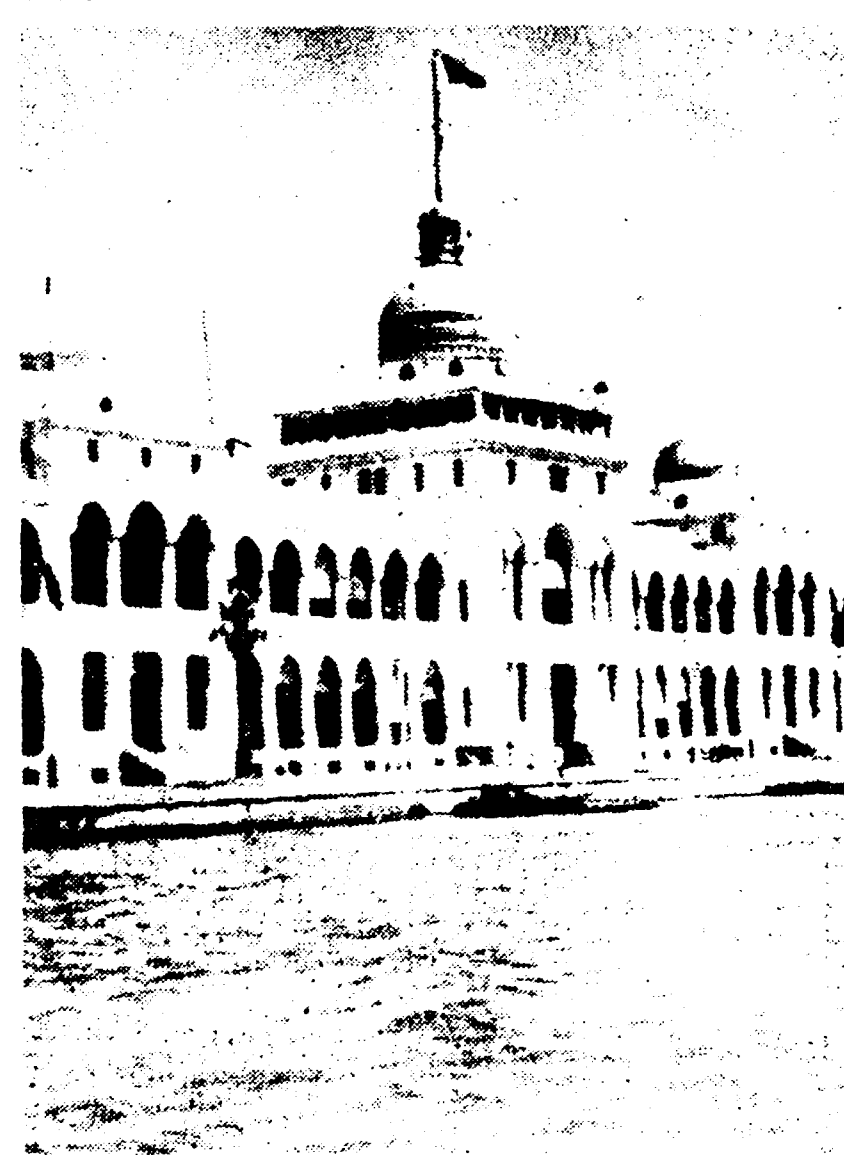
PORTO SAID — La sede della Compagnia del canale di Suez, su cui sventola ormai da due settimane la bandiera egiziana.

Il primo ministro del Laos Savanna Fama, ha comunicato oggi nel corso di una conferenza stampa a Pechino che il governo cinese ha offerto ai Laos aiuti economici che sono stati accettati.