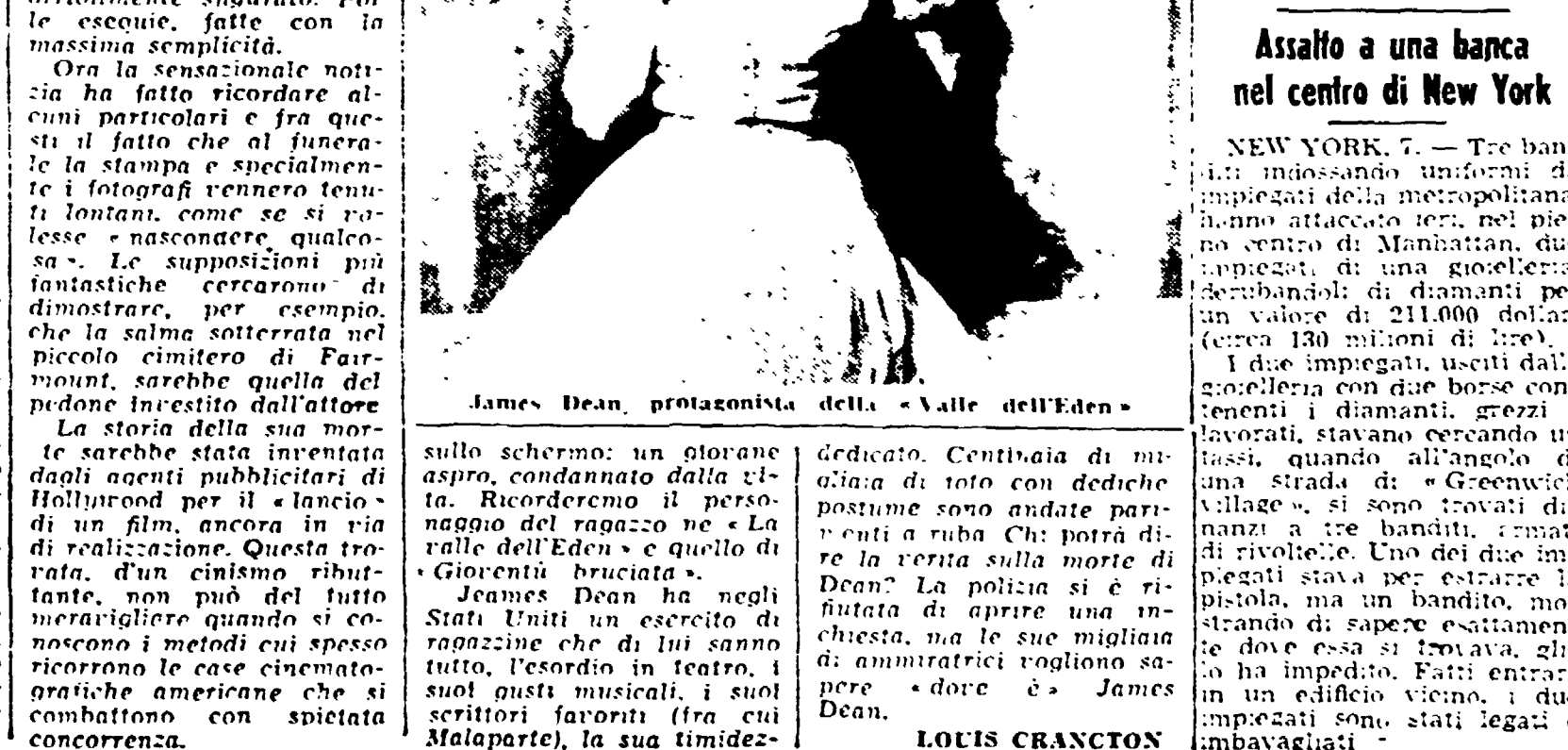
James Dean, protagonista della « Valle dell'Eden »