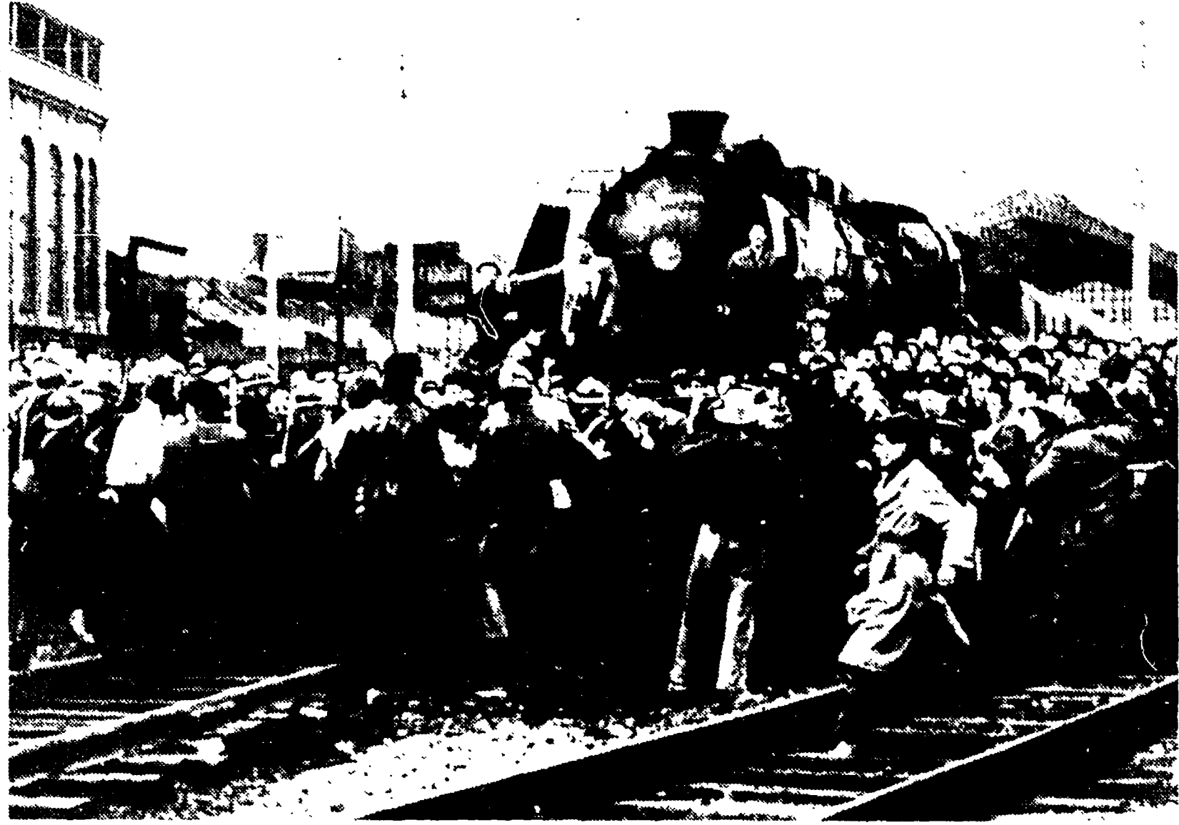
LE HAVRE - Duemila persone ieri mattina a Le Havre hanno impedito per due ore la partenza del treno delle 8.10 per Parigi, in cui dovevano viaggiare un gruppo di richiamati, destinati in Algeria. L'intervento della polizia ha determinato un violento scontro, in cui si lamentano parecchi feriti. Il commissario che era alla testa delle forze di polizia è stato atterrato e malmenato.

RIPRESA DEI CONTATTI DIRETTI U.R.S.S. - U.S.A.