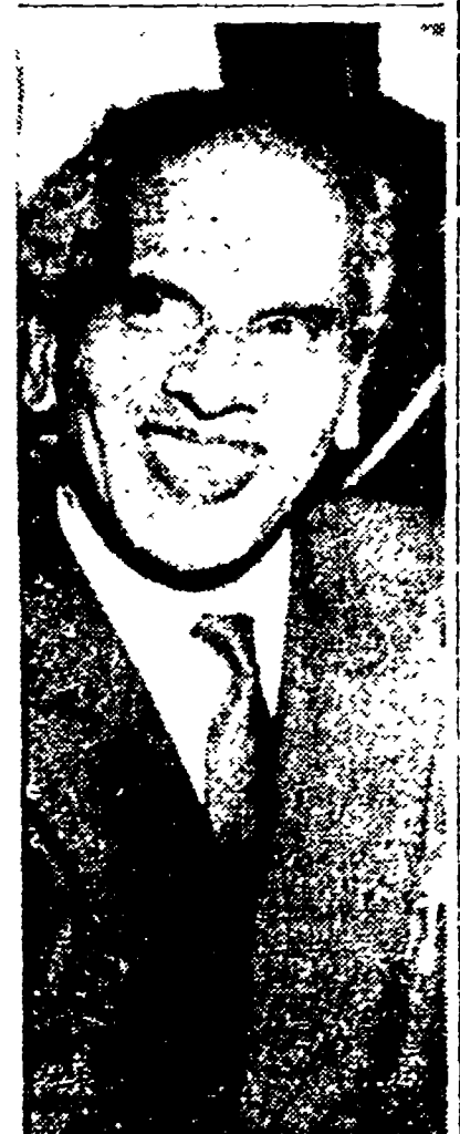
Il delegato indiano Menon

La seduta finale è stata breve e dedicata sostanzialmente a registrare il disaccordo, concretamente videro nell'impossibilità di redigere un comunicato, nonostante la insistenza di Scéplov e di altre delegazioni perché la conferenza stilesse almeno un documento che registrasse tutti i punti di vista espressi nel corso dei lavori e proponesse l'apertura di negoziati su questa larga base. Veniva invece stabilito, in mancanza di un accordo sul comunicato, che il presidente, e cioè il ministro degli Esteri inglese, Selwyn Lloyd, comunicati al governo egiziano gli atti del-