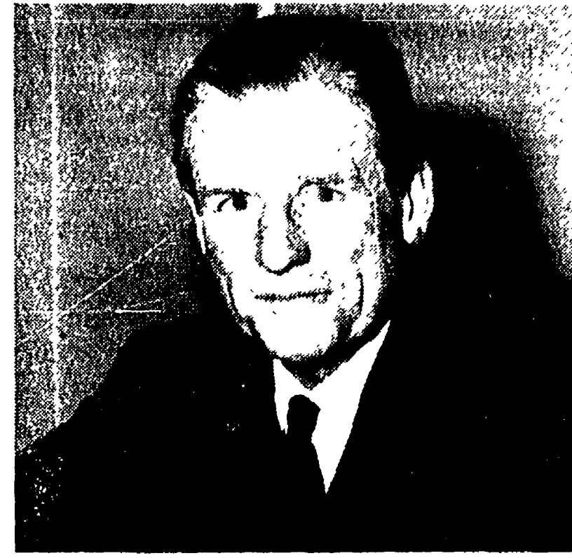
Sir John Harding, governatore inglese di Cipro

Il governatore inglese voleva esiliare i partigiani - Se le trattative per l'autogoverno non cominceranno entro lunedì l'EOKA riprenderà le armi