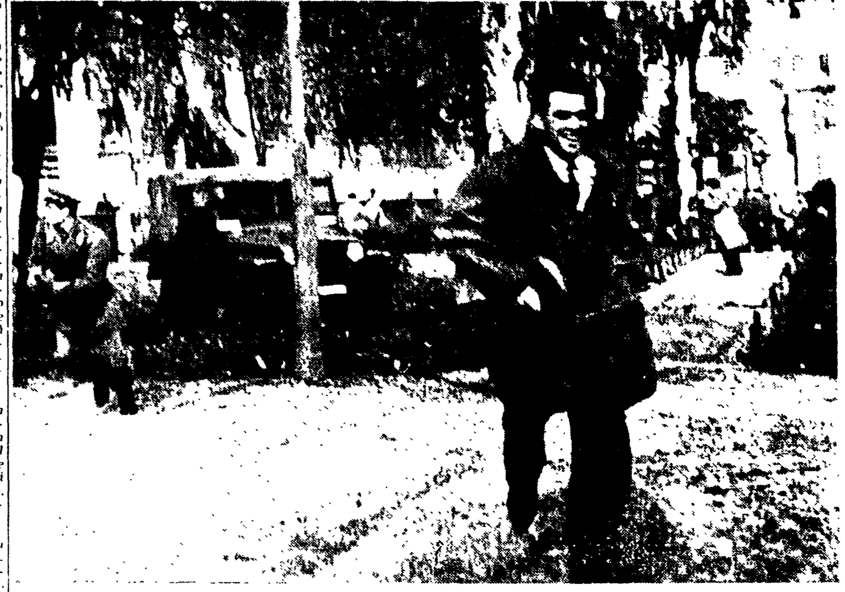
La polizia in azione contro gli studenti all'interno della Facoltà romana di Ingegneria a S. Pietro in Vincoli

L'ostinazione del ministro Moro a voler tenere - gli esami che costano - gli esami di Stato alla data fissata e con un regolamento che tutto il mondo accademico ed ordini professionali oltre che la maggioranza dei parlamentari investiti dalla questione, hanno giudicato assurdo e incostituzionale ha gettato ieri tutte le Università italiane in una situazione scandalosa, indegna di un paese civile.