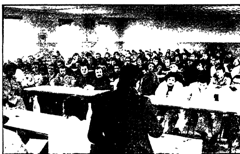
dipendenti della Metalsud durante l'assemblea aperta di ieri.

La federazione regionale CGIL-CISL-UIL ha chiesto incontri con ministri per discutere la piattaforma rivendicativa. Assemblea aperta alla Metalsud - In lotta numerosi istituti di credito - Prosegue il presidio alla clinica Don Bosco