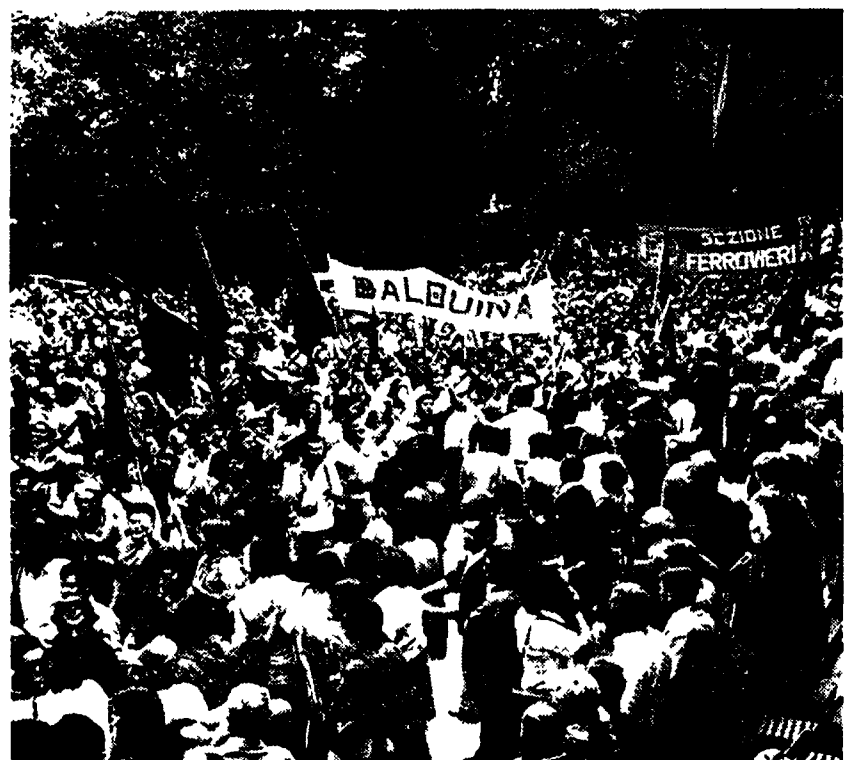
Una moltitudine di lavoratori provenienti da tutta Italia e dall'estero.