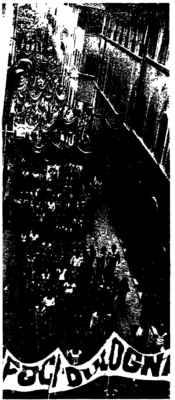
Tutta la città ha vissuto un'indimenticabile giornata.