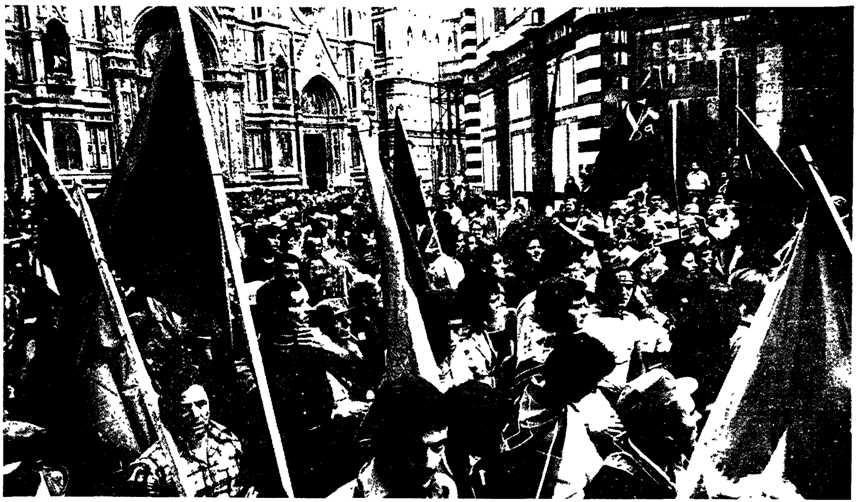
L'interminabile corteo di folla mentre sfilava in piazza del Duomo, accanto al Battistero.