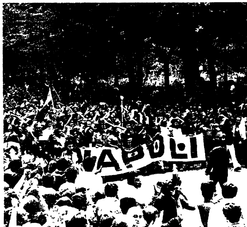
Massiccia la partecipazione dei compagni del Mezzogiorno.