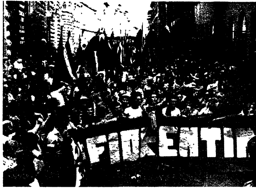
Sfilano i compagni di Firenze, che con il loro appassionato lavoro hanno allestito e gestito per 15 giorni la «città del Festival».