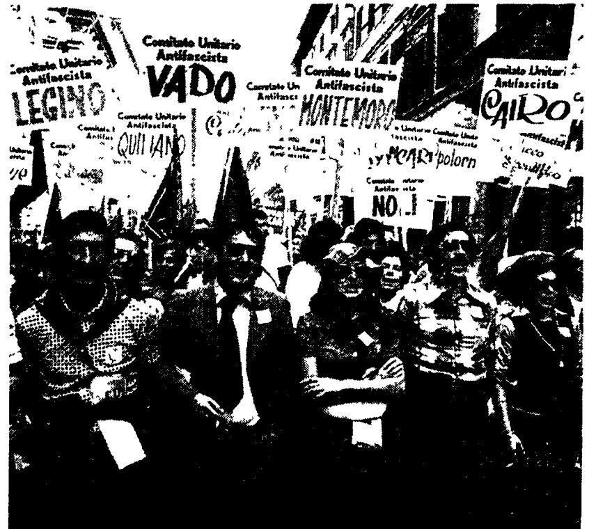
Un'imponente manifestazione di impegno antifascista.