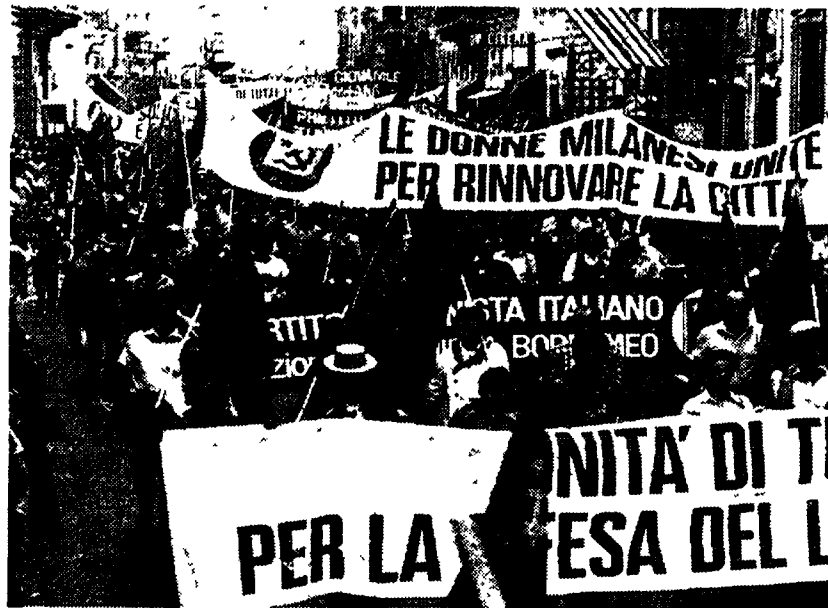
Le donne, protagoniste della crescita democratica del Paese.