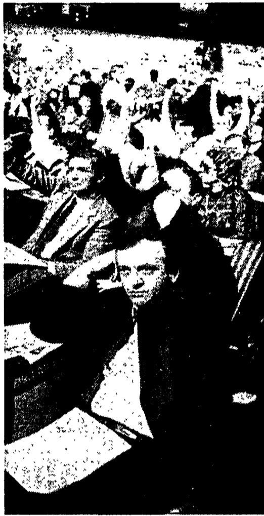
Delegati al Congresso durante la votazione

Si vota, per il Consiglio nazionale. 40 voti contro e 62 astensioni, che calano progressivamente per gli altri due organismi. Si annuncia la procedura successiva, per l'elezione del segretario. E mentre cade la tensione di questa prima seduta, molta gente si avvia all'uscita. Sono i delegati non eletti nel Cn e forse qualcuno di più.