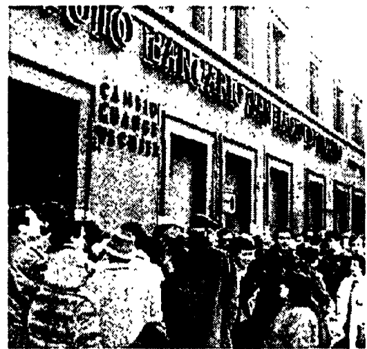
File davanti alle banche, ieri mattina

La giornata di ieri ha invece fatto registrare un piccolo spiraglio nella vertenza dei bancari: gli scioperi a ritmo ridotto che anche ieri hanno bloccato alcune banche (specie a Milano) si concluderanno venerdì. E per ora saranno gli ultimi: oggi i sindacati decideranno infatti di tenere gli sportelli aperti per tutta la settimana dopo la Befana e già ieri hanno comunicato alle controparti e al ministro del Lavoro Donat Cattin la disponibilità a riprendere le trattative, forse il 9 gennaio. Ancora polemiche sul diritto di sciopero.