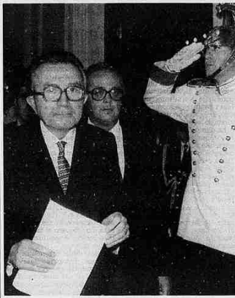
Giulio Andreotti lascia lo studio di Cossiga con la lista dei ministri

ROMA. San Sebastiano torna ad essere traffico delle froccie. Anzi peggio. Quando il governatore della Banca d'Italia, Guido Carli teneva nel suo studio una tavola a olio del '400 con la consueta raffigurazione del giovane martire uovo e ferito. Gli piaceva vedersi così, torturato dalle richieste dei politici perché allargasse i cordoni della borsa, perché acconsentisse a espandere la spesa. Da governatore, Carli rimproverava ai politici una mentalità simile a quella che, a vaghezza di campagna che in una lingua lettera, espellendosi al suo buon cuore, gli aveva chiesto: «Visto che lei stampa tante banconote, non può stampare due milioni in più per me?». Ora, da politico tra i politici, Carli dovrà far più che rispondere di no: ministro del Tesoro, dovrà imporre a tutti i colleghi di governo di spendere meno. Su questo punto, almeno fino a qualche giorno fa, le sue ricette erano drastiche. Una volta, come ci vuole, ha detto, «Per abbassare la febbre dell'inflazione occorre una stretta al consumo». Servono provvedimenti più severi per la spesa pubblica perché quelli finora presi sono inadeguati. Ma non si scriveva queste parole, certo Carli non immaginava che Giulio Andreotti gli avrebbe fatto entrare nel suo governo. E in un governo che sembra partire con un programma economico piuttosto vago.