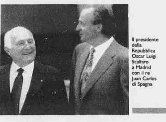
Il presidente della Repubblica Oscar Luigi Scalfaro a Madrid con il re Juan Carlos di Spagna