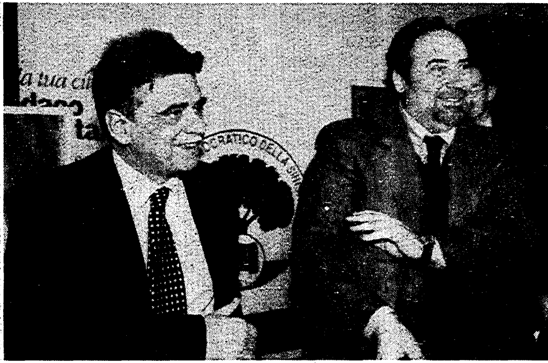
L'incontro fra Achille Occhetto e Ottaviano Del Turco

Incontro alle Botteghe Oscure tra Occhetto e Del Turco: «Sussistono tutte le condizioni perché sia rapidamente convocato il tavolo progressista anche col Psi». Ma Orlando reagisce polemicamente: «Non si possono liquidare così le posizioni della Rete...»