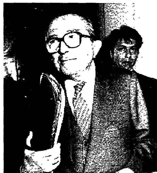
Il senatore democristiano Giulio Andreotti

e nel mondo il pluridecennale potere democristiano? Quale sarà la sua linea di difesa? Dirà ancora che contro la sua persona è stata ordita una trama, una congiura, un'«infame macchinazione» i cui protagonisti sono da cercare fra gli «inaffidabili» giudici di Palermo, i «manovrati» pentiti di mafia, le grandi lobby finanziarie ed editoriali, gli «amici» americani? Distinguerà la sua posizione e la sua storia personale e politica dalla parabola democristiana? Insisterà nella sua richiesta di perseguire i pentiti che risiedono negli Stati Uniti, modificando o interpretando all'uso il trattato internazionale sottoscritto sotto la sua gestione governativa? Quel che è certo è che Andreotti esibirà un elenco minuzioso e dettagliato dei provvedimenti contro il narcotraffico e la mafia varati dai governi in cui era presente (attività, questa, pe-