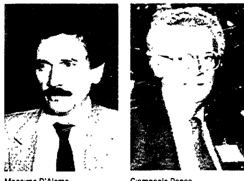
Massimo D'Alema Giampaolo Pansa