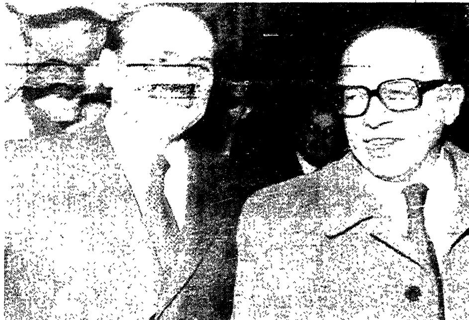
Fedele Confalonieri insieme a Silvio Berlusconi e, a fianco, Ciriaco De Mita ed Enrico Mentana

Parole chiare, polemiche in linea con i dubbi e la perplessità che l'onorevole De Mita continua ad avere sull'operato dei giudici di Napoli in relazione all'accusa di concussione, poi arricchita, e di interesse privato in atti d'ufficio avanzata contro di lui per presunte raccomandazioni fatte ad un industriale irpino perché assumesse alcune persone. Il segretario di De Mita era stato arrestato con le stesse accuse. «Sono convinto