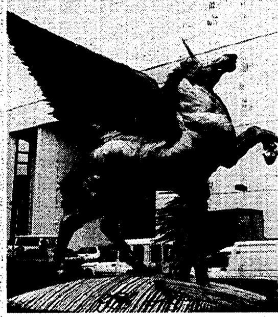
SILVIA GARAMBOIS CINZIA ROMANO A PAGINA 5