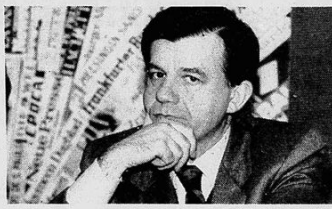
Il ministro dell'Ambiente Valdo Spini

ROMA. La Camera ha approvato l'abolizione dell'immunità parlamentare con 489 sì, tre voti contrari e sei astensioni... L'advocato di garanzia è stato riproposto al suo significato vero. Cioè, una comunicazione del magistrato ad un cittadino per dirgli che si sta indagando su di lui.