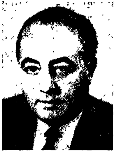
Jean de Broglie

PARIGI, 26 dicembre. Un misterioso delitto è avvenuto la vigilia di Natale nella capitale francese. La vittima è il noto deputato giscardiano Jean de Broglie, che aveva ricoperto nel passato numerosi incarichi governativi. L'assassino, stando ai numerosi testimoni, sarebbe un giovane non più che ventenne, vestito con un maglione o del «blue jeans».