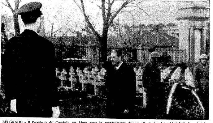
BELGRADO - Il Presidente del Consiglio, on. Moro, sosta in raccoglimento dinanzi alle tombe dei soldati italiani, caduti in Jugoslavia nella prima guerra mondiale