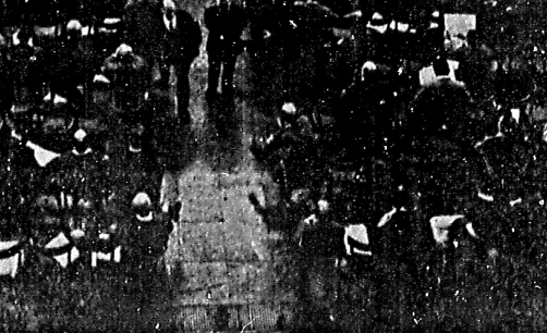
Un'altra veduta panoramica della sala