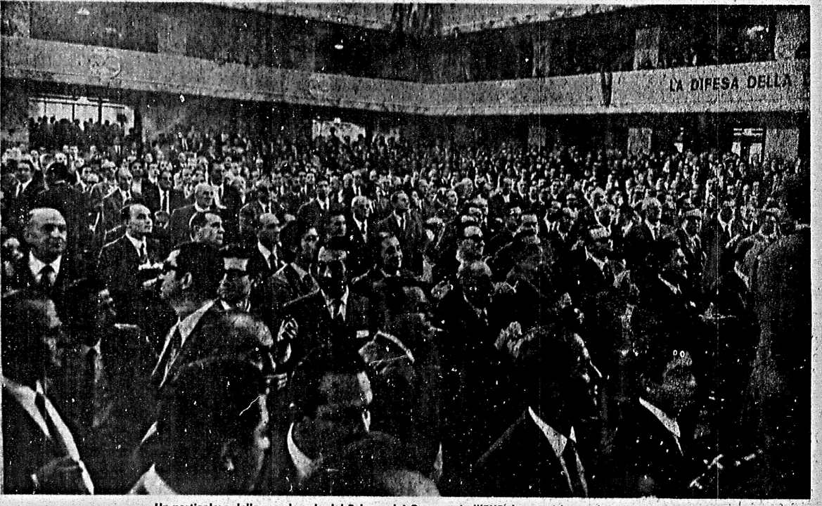
Un particolare della grande sala del-Palazzo del Congressi all'EUR durante i lavori di ieri mattina