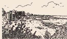
> Plage des Grands Sables