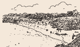
> Plage du Kérou