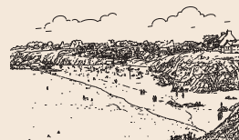
> Plage du Kérou