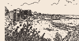
> Plage des Grands Sables