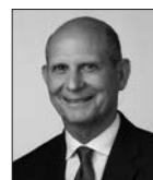
* È stato presidente della Conferenza Generale della Chiesa Avventista dal 2010 al 2025.