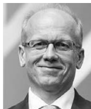
*Tesoriere della Divisione Intereuropea (EUD) della Chiesa Cristiana Avventista del Settimo Giorno