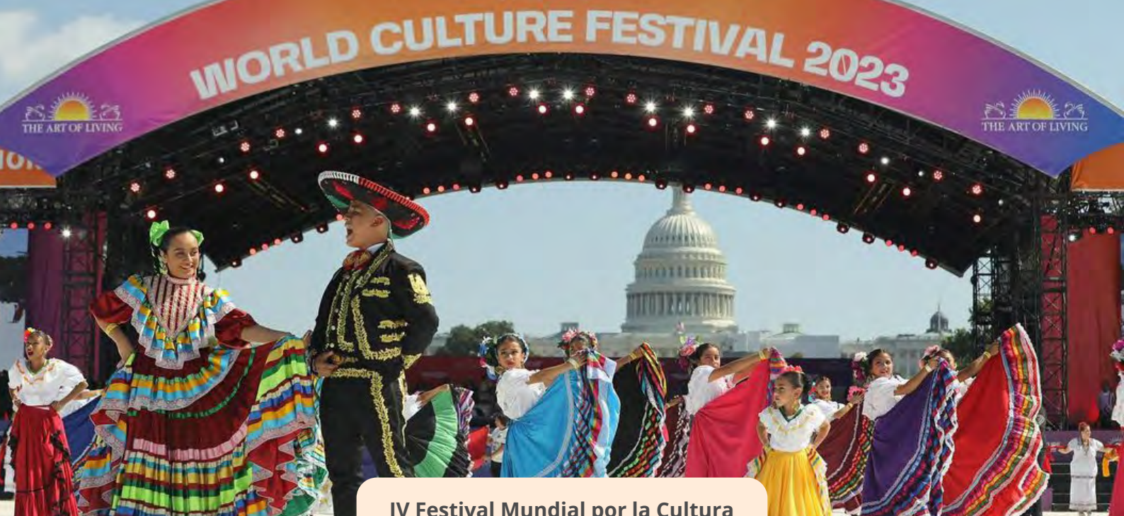
IV Festival Mundial por la Cultura 2023, Washington, D.C.