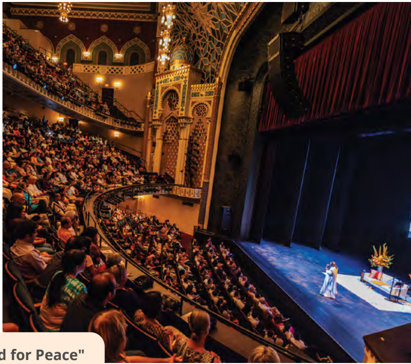
Gira "I Stand for Peace" Estados Unidos, 2023