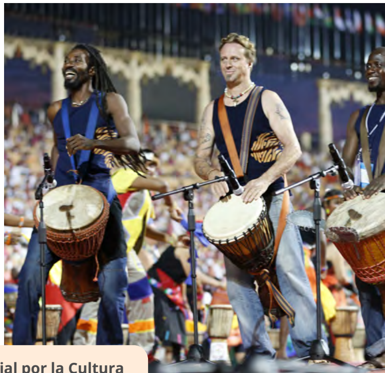
III Festival Mundial por la Cultura 2016, Nueva Delhi, India