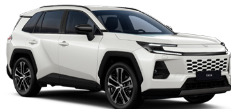
089 Platinum White Pearl lakier perłowy 4 400 PLN – Comfort, Executive