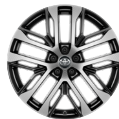
20" felgi aluminiowe w kolorze czarnym ze srebrnym wykończeniem z oponami 235/50 R20 Standard w wersji Executive