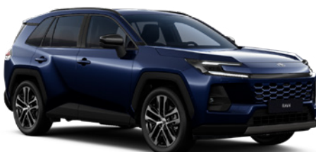
8X8 Elite Blue lakier metalizowany 2 900 PLN – Comfort, Executive