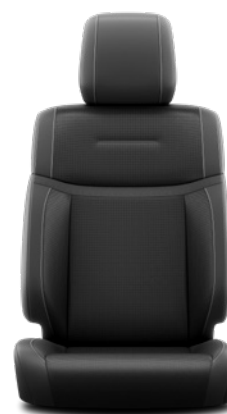
Tapicerka skórzana w kolorze czarnym (skóra naturalna i syntetyczna) Standard w wersji Executive