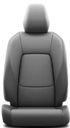
Tapicerka materiałowa w kolorze czarnym Standard w wersji Comfort