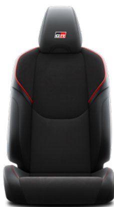
Tapicerka zamkowo-skórzana z czerwonymi przeszyciami i logo GR (materiały syntetyczne) Standard w wersji GR SPORT