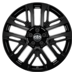
20" felgi aluminiowe w kolorze czarnym z oponami 235/50 R20 Standard w wersji Style