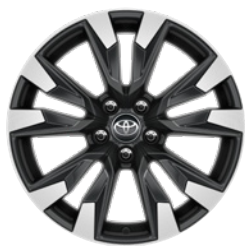
18" felgi aluminiowe z oponami 235/60 R18 Standard w wersji Comfort