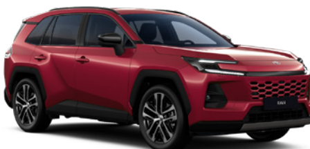
3T3 Tokyo Red lakier specjalny 4 400 PLN – Comfort, Executive