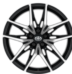
20" felgi aluminiowe GR SPORT z oponami 235/50 R20 Standard w wersji GR SPORT