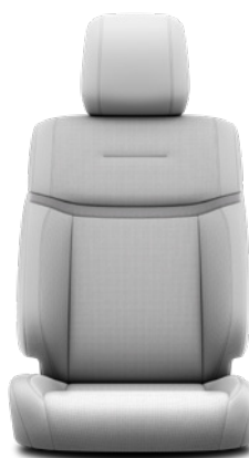
Tapicerka skórzana w kolorze szarym (skóra naturalna i syntetyczna) Standard w wersji Executive