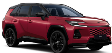
2NF Tokyo Red/ Eclipse Black lakier specjalny bez dopłaty – Style