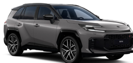
M38 Urban Rock/ Eclipse Black lakier metalizowany bez dopłaty – Style, GR SPORT