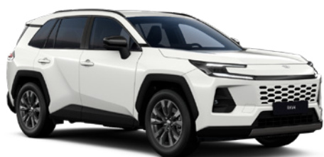
040 Pure White lakier podstawowy 1 200 PLN – Comfort