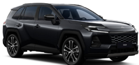
218 Attitude Black lakier metalizowany bez dopłaty – Comfort, Executive