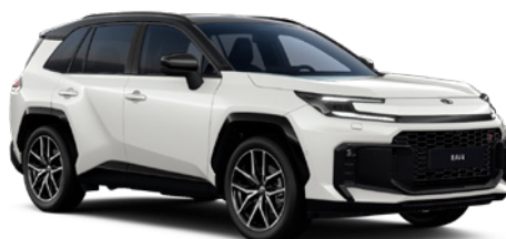
2VP Platinum White Pearl/ Eclipse Black lakier perłowy bez dopłaty – Style, GR SPORT