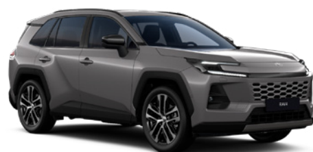
1M6 Urban Rock lakier metalizowany 2 900 PLN – Comfort, Executive