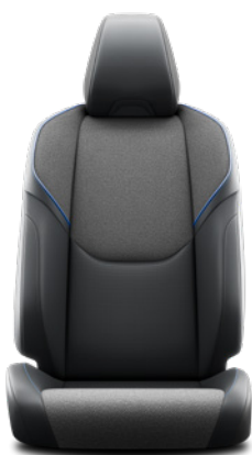
Tapicerka zamkowo-skórzana w kolorze czarnym z niebieskimi przeszyciami (materiały syntetyczne) Standard w wersji Style