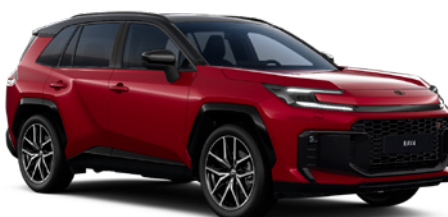
2TB Imperial Red/ Eclipse Black lakier specjalny bez dopłaty – GR SPORT