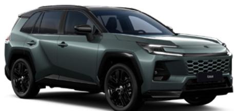
M39 Forest Green/ Eclipse Black lakier metalizowany bez dopłaty – Style