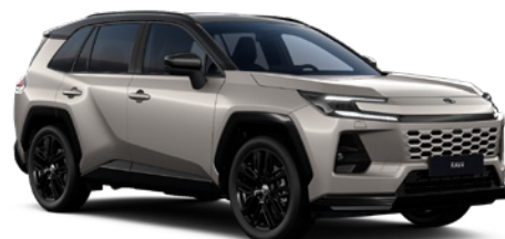
2SQ Avant-garde Bronze/ Eclipse Black lakier metalizowany bez dopłaty – Style