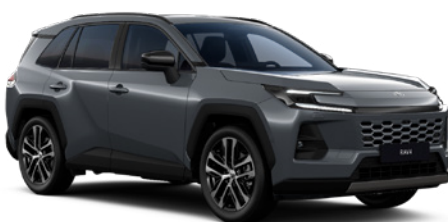
1L6 Massive Grey lakier metalizowany 2 900 PLN – Comfort, Executive