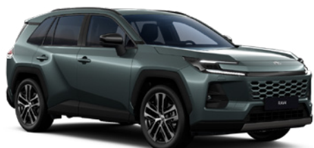
6X7 Forest Green lakier metalizowany 2 900 PLN – Comfort, Executive