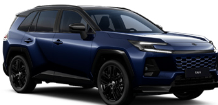
M40 Dark Blue/ Eclipse Black lakier metalizowany bez dopłaty – Style