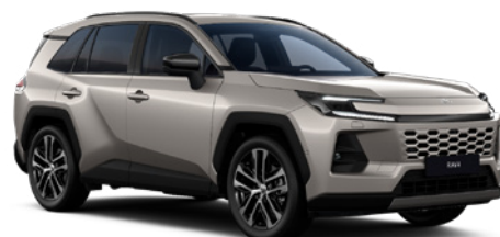
4V8 Avant-garde Bronze lakier metalizowany 2 900 PLN – Comfort, Executive