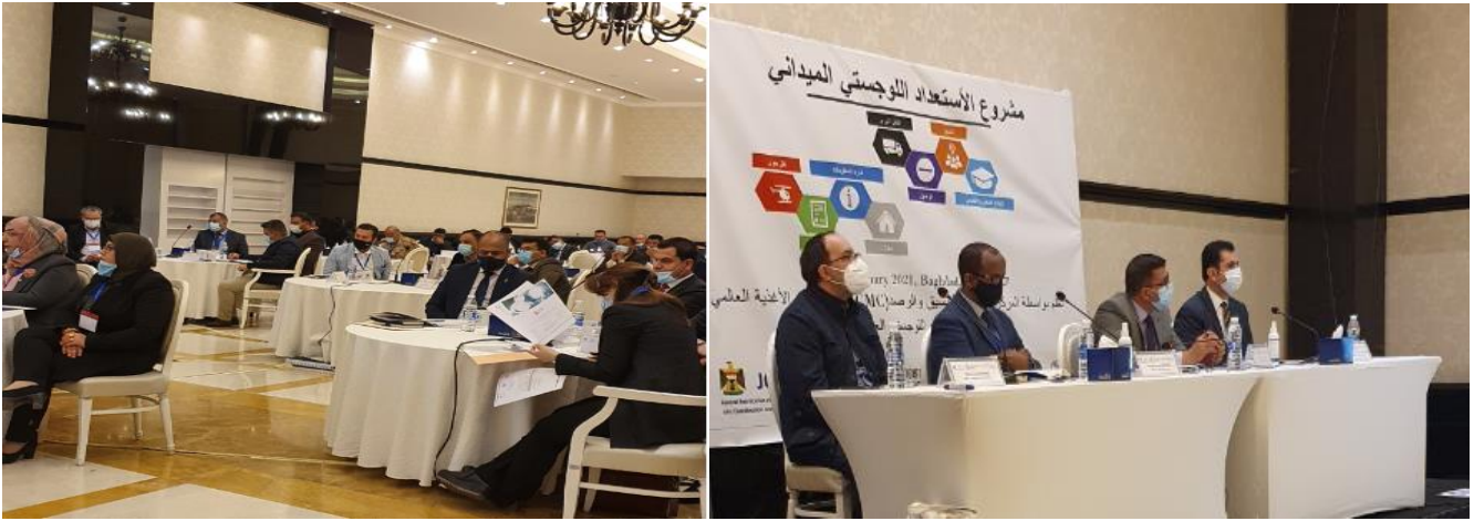
بعض المشاركين من المركز العمليات الوطني والمركز المشترك لتنسيق الازمات و وزارة الصحة و وزارة التجارة وغيرهم.