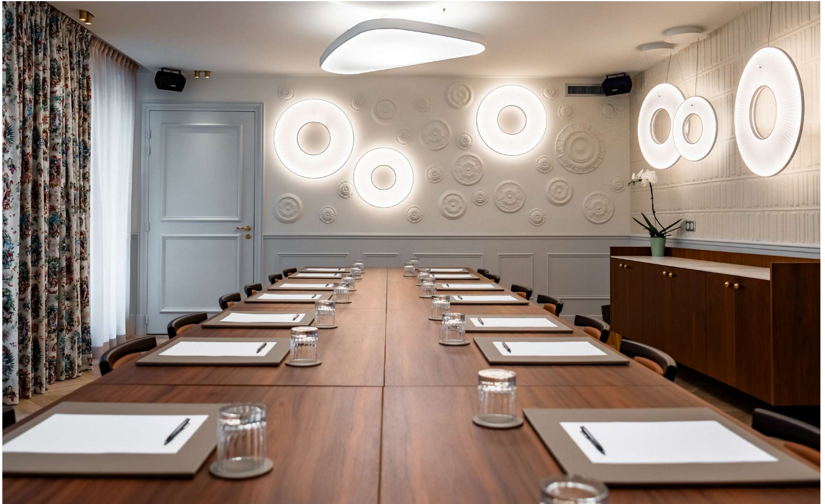
CONFIGURATION : BOARDROOM 18-24 PLACES