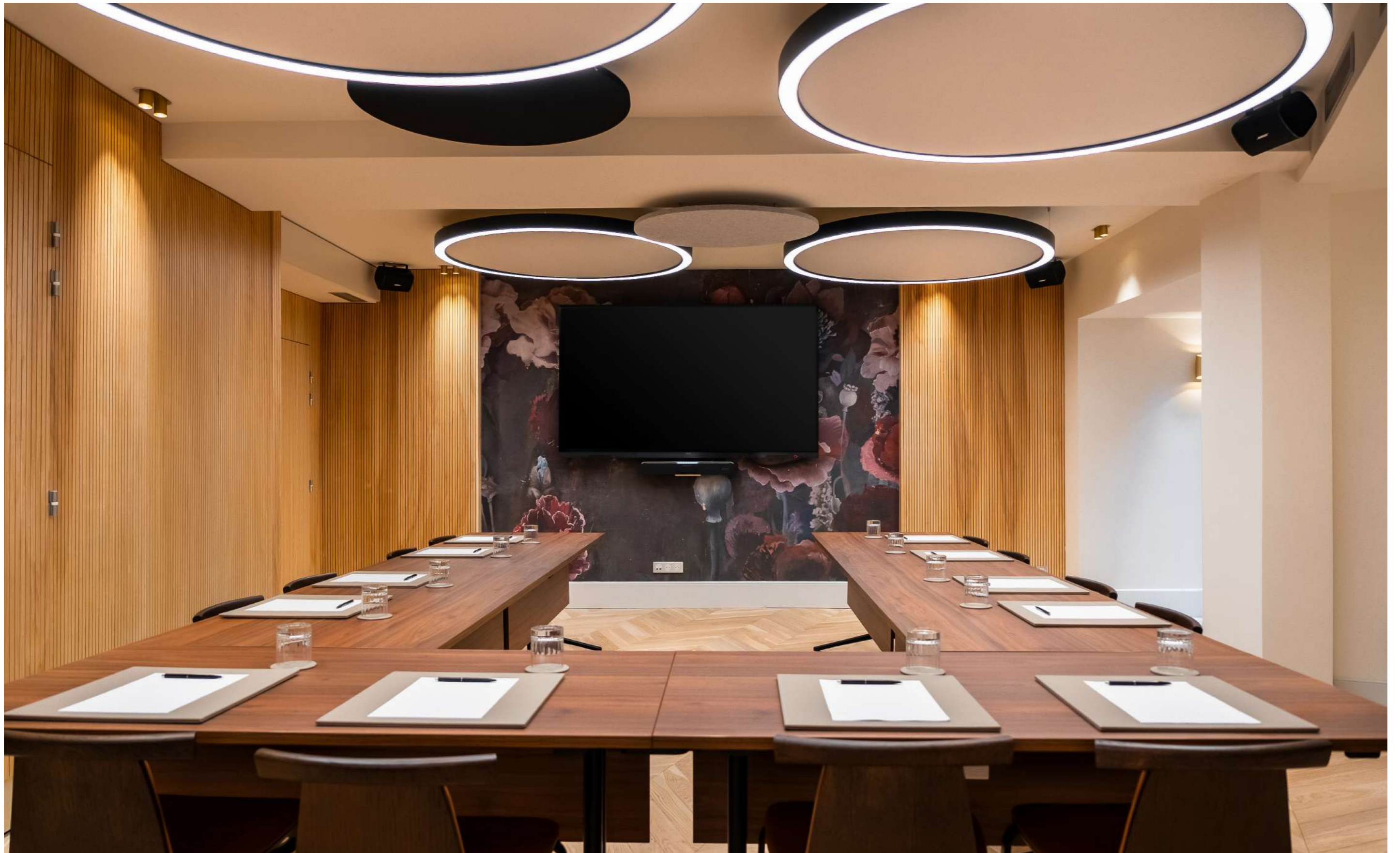
CONFIGURATION : U, 32 PLACES