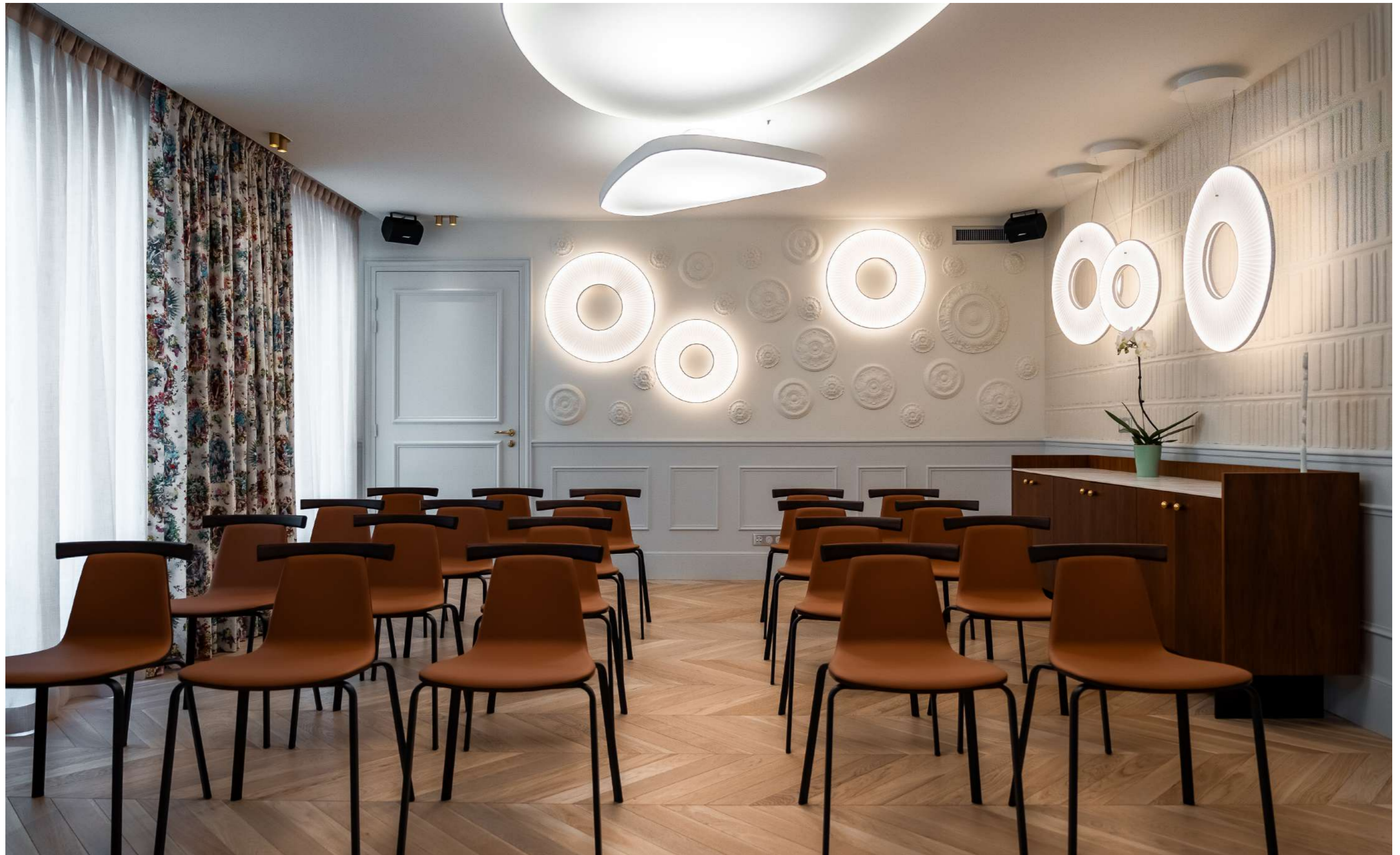
CONFIGURATION : THÉÂTRE 42 PLACES