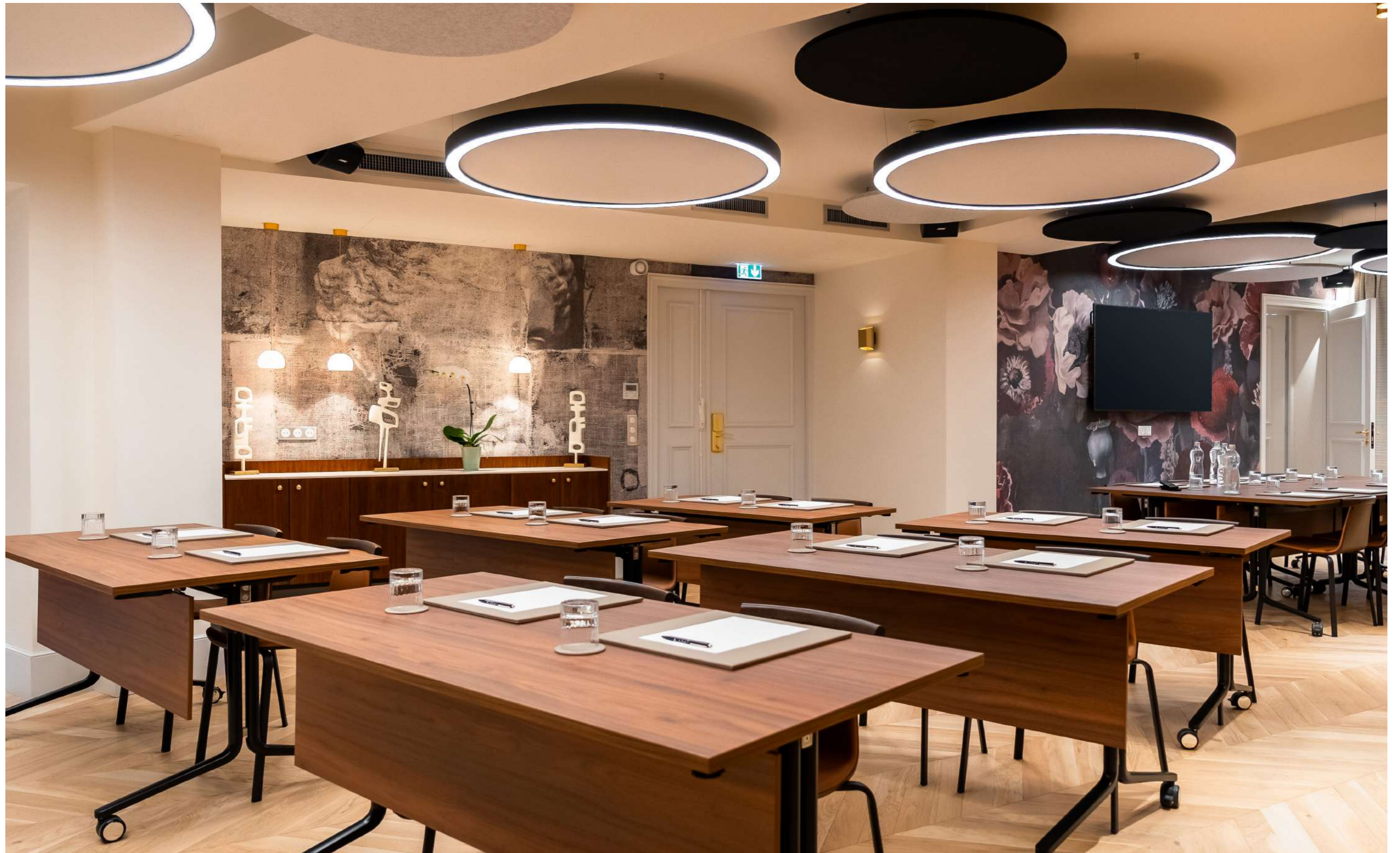
CONFIGURATION : CLASSE 28 PLACES