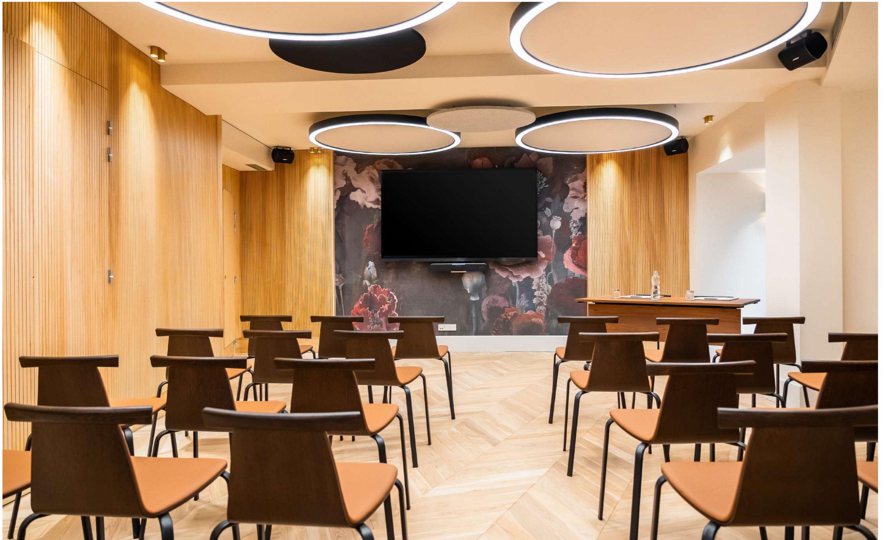
CONFIGURATION : THÉÂTRE 60 PLACES