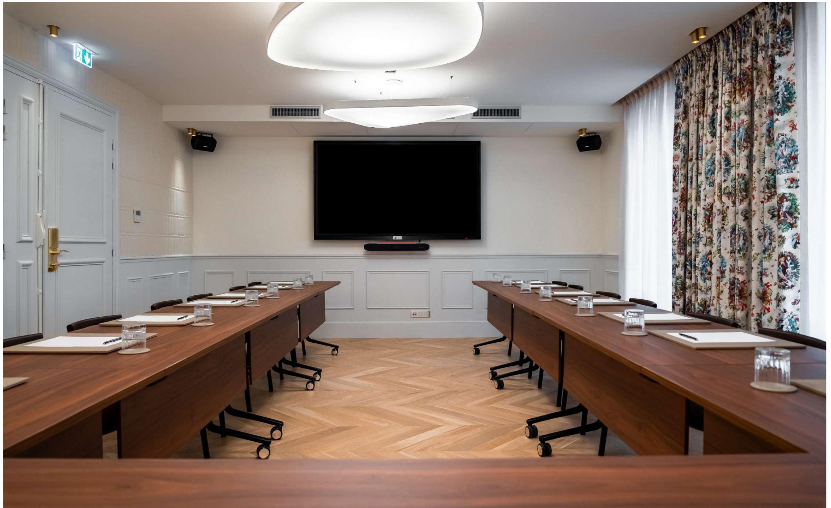
CONFIGURATION : U, U SERRÉ, DOUBLE U 20-24-32 PLACES