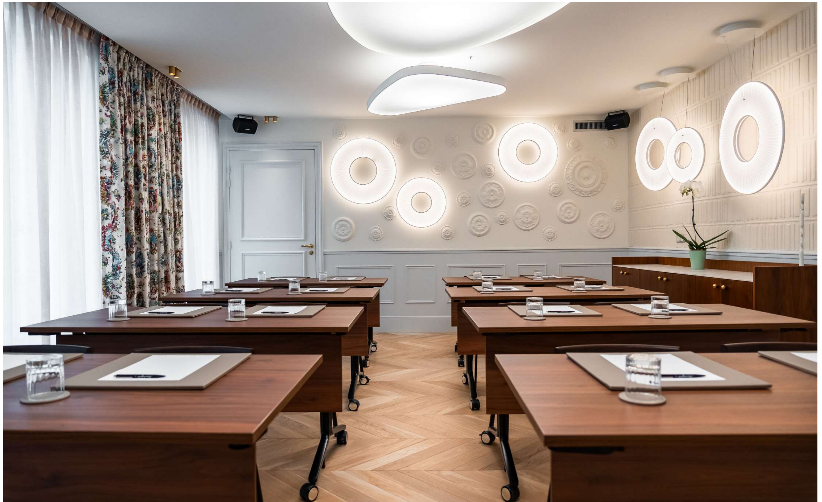
CONFIGURATION : CLASSE 20 PLACES