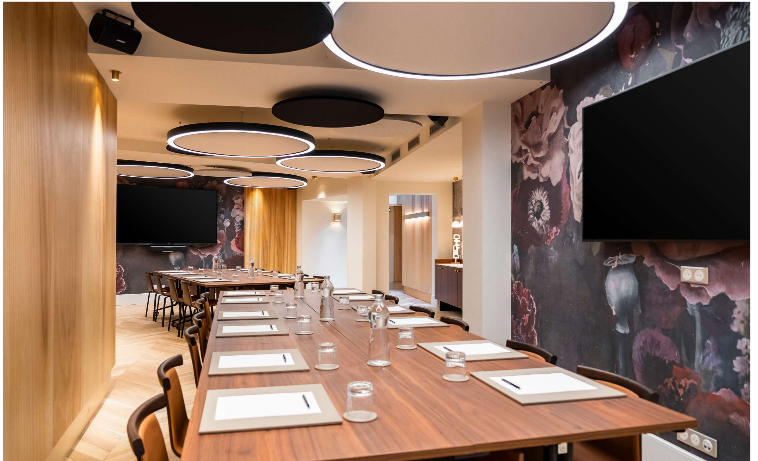
CONFIGURATION : BOARDROOM 36 PLACES