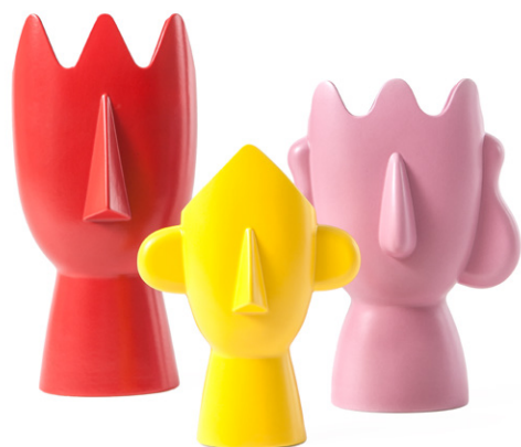
Diavoletto - Diavoletta - Diavoletto Baby

Diavoletto - red vase Diavoletta - pink vase Diavoletto baby - yellow vase