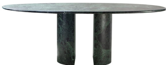
tavolo in marmo - marble table

Marble table with oval top in white Carrara marble, green Alps marble or light straw-yellow travertine. Two loose semicircular bases in the same material.