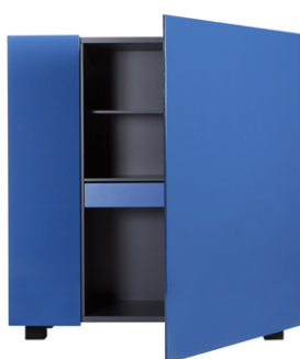
madia alta - sideboard

Cabinet in two different dimensions characterized by a perfect balance between the rigor of formal rationalism and the innovation of materials, as well as the pleasant chromatic contrast between the case, matt lacquered in anthracite color, and the doors, available matt or polish lacquered or in the new metallic polish lacquer in four different colors. The total lack of handles and decorative elements enhances how light and extremely linear the surfaces of this architectural product are. Specific hinges have been designed to open the doors.