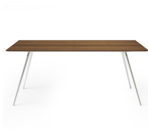
piano rettangolare - rectangular top

Rectangular, round or square table, with conical stainless steel legs in different finishing, top in a selection of woods and marbles, matt or polished lacquer.