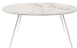
piano rotondo - round top

STY1 tavolo 140x140 / table 140x140 STY2 tavolo 180x90 / table 180x90 STY3 tavolo 220x90 / table 220x90 STY4 tavolo Ø140 / table Ø140 STY6 tavolo Ø180 / table Ø180