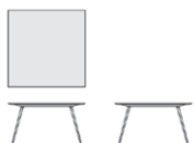
STY1 cm. 140x140x72h inch 55"x55"x28" 1 / 4 h