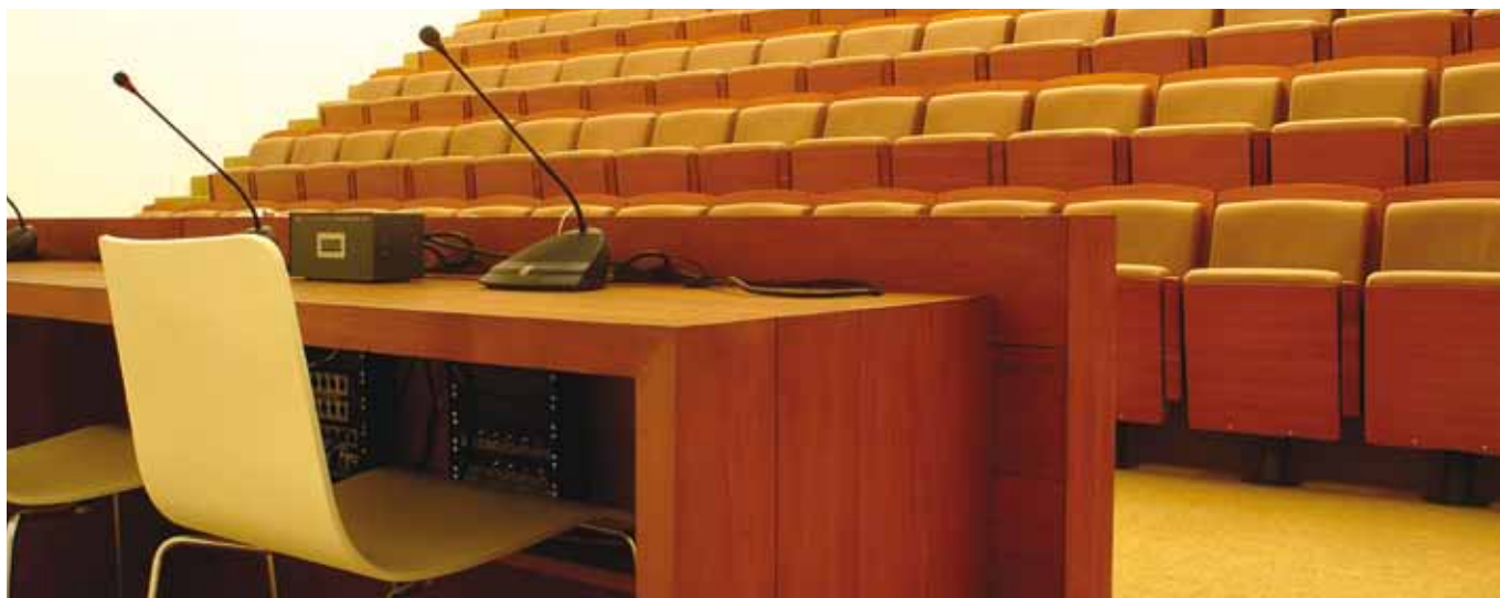
Fondazione Sandretto Re Rebaudendo, Turin