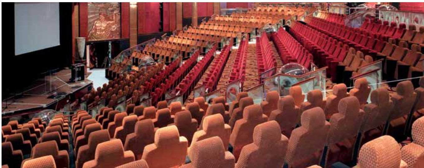
Special edition for Queen Mary 2