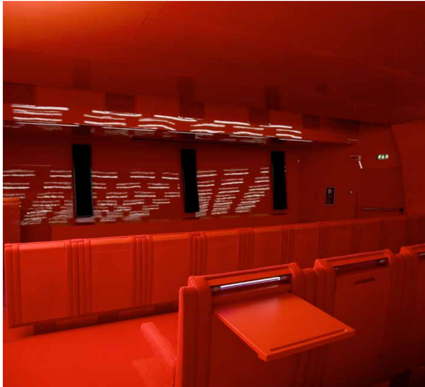
Macro Museum, Rome

Rome 2005 - Rome2005 is inspired by 21st Century Art and design. Streamlined and high tech, the seat has an ultra-modern aesthetic, which strikes a dynamic, complementary juxtaposition with any style or period of architecture it inhabits.