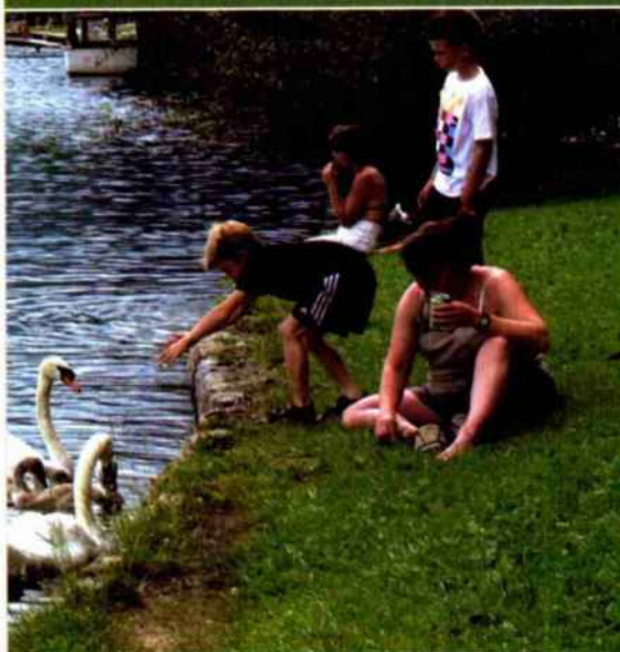
↑ בכניסה לחוף המצודה

פארק מים מקורה: אם יורד גשם אפשר לנסוע לפארק המים המקורה החדש והיפה בבוהינסקה ביסטריצה (Bohinjska Bistrica), פחות מחצי שעה נסיעה מבלד. שיט רפטינג: מבלד אפשר לצאת לשיט רפטינג בנהר סוזה (Sava). השיט מתאים לכל המשפחה, והסוכנויות המפעילות את הרפטינג דואגות להסעה, לציוד ולכל הנחוץ. טיול אופניים: תוכלו לשכור אופניים, כולל אופני ילדים, בלשכת התיירות של בלד או בסוכנות הנוסיעות קומפס (Kompas, במרכז המסחר) ולרכוב סביב האגם במסלול מישורי וקל או לנסות את שביל האופניים המחבר בין בלד ליעיירה רדובלייצה. טיסות בשמי סלובניה: סמוך לבלד, בעיירה לסצה (Lesce), נמצא שדה תעופה קטנטן שממנו יוצאות טיסות פורמיות מעל האגם ומעל שמורת טריגלב (Triglav). פרטים באתר האינטרנט: www.alc-lesce.si/?page=main&lang=en