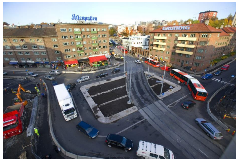
Carl Berners plass