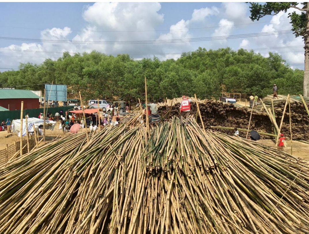
Кокс зах дахь хулсны хуваарилалт, Бангладеш