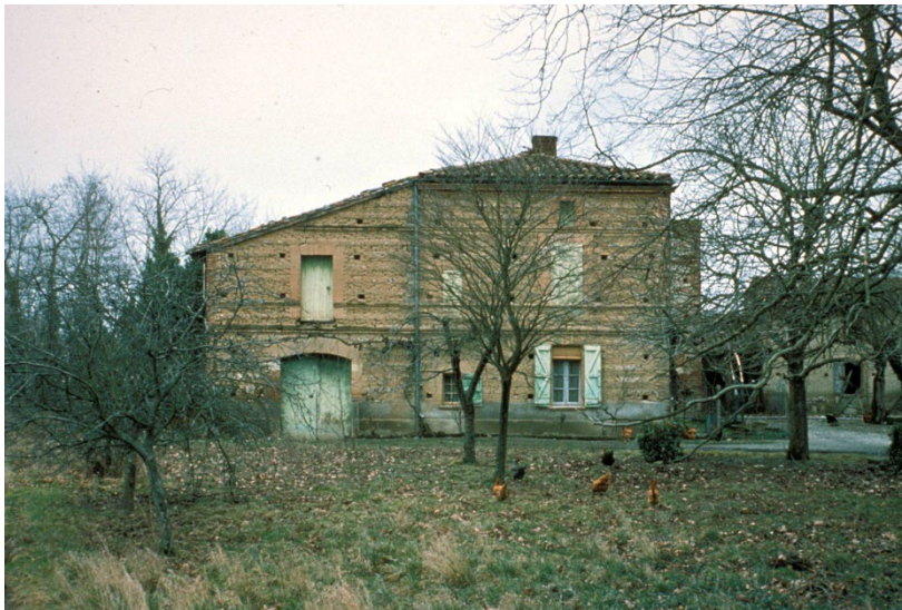
3. Maison en Adobe, France; Région Toulousaine