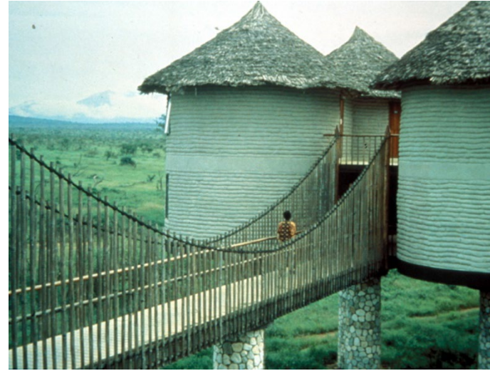
Hôtel en adobe; Kenya