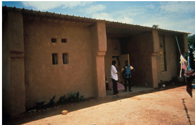
Ecole en adobe, Burkina Faso