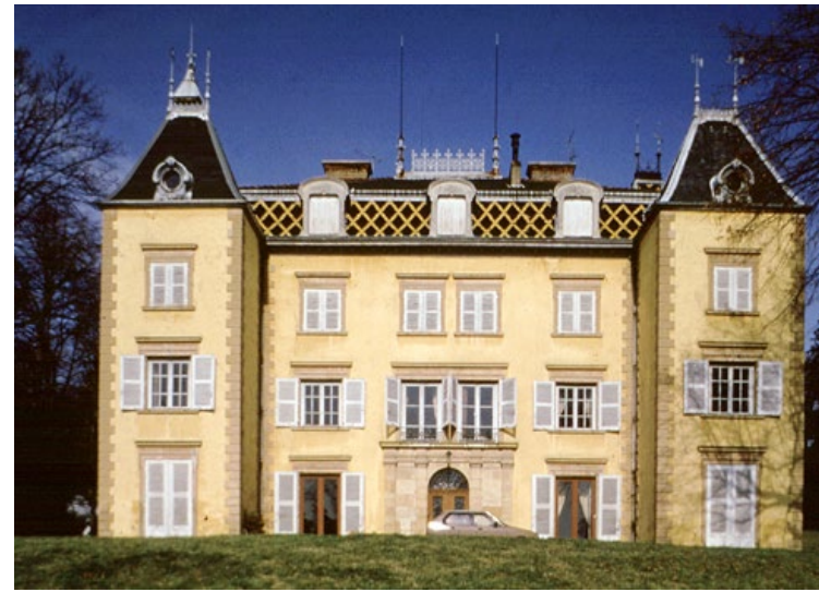
2. Maison en Pisé, France; Basin Grenoblois