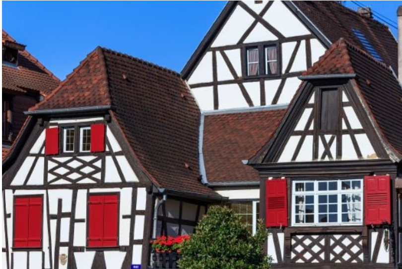
1. Maison en Torchis, France; Alsace et Normandie