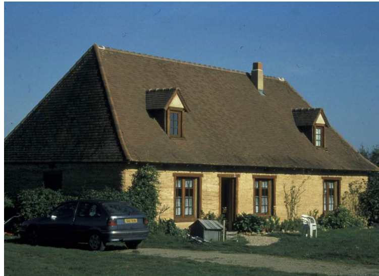
4. Maison en Bauge, France; Région Bretagne et Cotentin