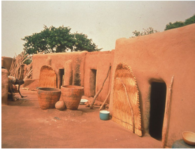
Maison en adobe, Burkina faso