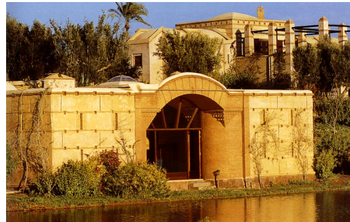
Résidence en Pisé; Maroc

Des savoirs et savoirs faire, parce que nous ne pouvons pas faire autrement?