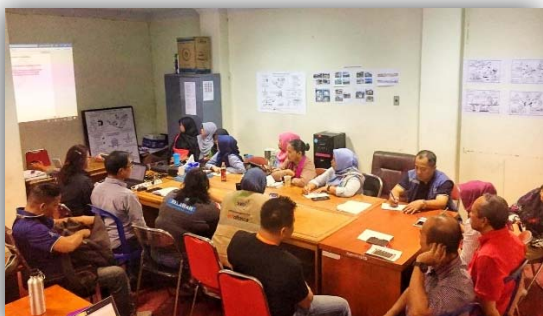
Picture 3. Preparation meeting for Women Forerunner in Reconstruction Program

➤ The Shelter Sub Cluster Team Coordinator is also participated as a facilitator in the Shelter Coordinator Training for the Asian region that held in Hanoi, Vietnam on 4-9 November 2019.