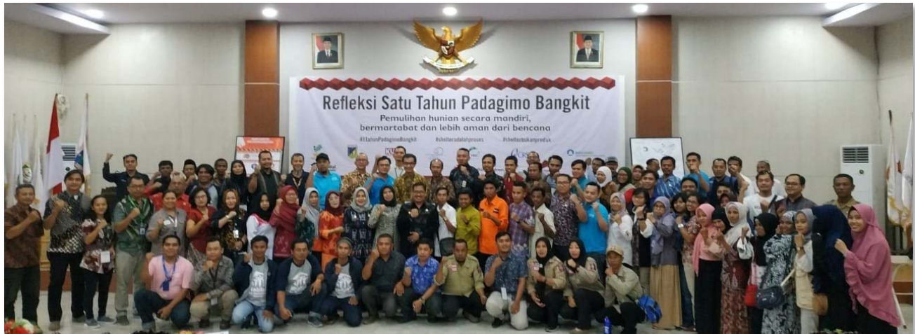
Picture 5. Participants of the One Year Reflection of Palu, Donggala, Sigi, and Parigi Moutong (Padagimo) Rising

On 28 September 2019, members of Shelter sub cluster in Central Sulawesi reflected on lessons learned relates shelter issues on disaster management with the theme of “Restoration of dwellings through self-recovery, with dignity, and safer from disasters”, organized by the Central Sulawesi Provincial Social Affairs office together with members of Shelter sub cluster in Central Sulawesi. More than 200 participants participated in this event. In this event, the paradigm stressed on “Shelter is a process not a product”.