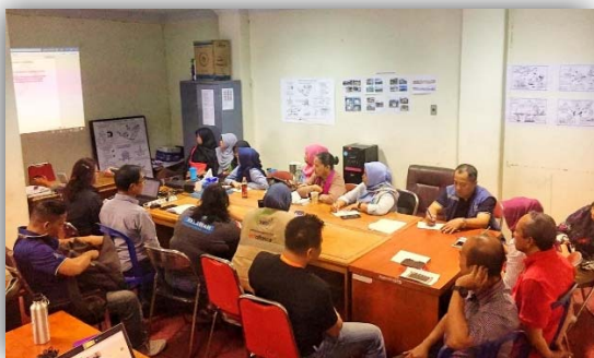
Gambar 3. Pertemuan persiapan peluncuran program Ibu Pelopor Rekonstruksi