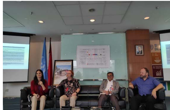
Picture 1. PSKBA Director, Head of IFRC Office in Indonesia, Head of UN OCHA in Indonesia, along with shelter sub cluster members on shelter quarterly meeting.

The purpose of this regulation is to ensure that all of humanitarian assistance related to shelter meets the agreed minimum social standards. This regulation is expected to become a reference for humanitarian actors engaged in the shelter sector and the number is growing rapidly and also response to the challenges that have arisen so far in handling shelter, such as the form and type of assistance provided, reporting mechanisms from aid providers, as well as the principles and standards that need to be met in the provision of assistance related to shelter.