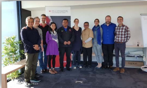
Gambar 2. Delegasi Kementerian Sosial RI bersama tim pendukung koordinasi sub kluster shelter dan tim kluster shelter global IFRC