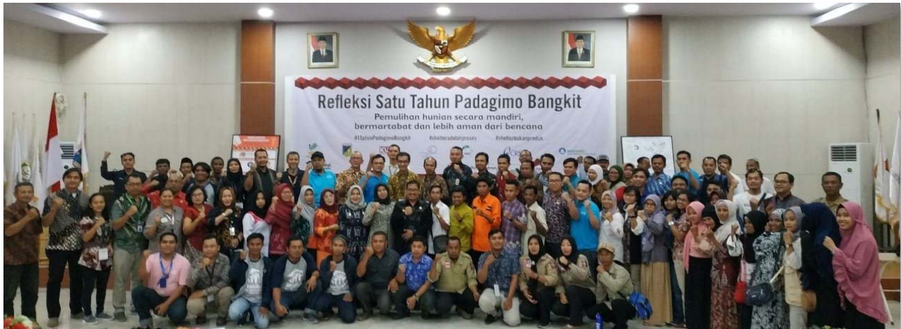
Gambar 5. Para Peserta Refleksi Satu Tahun Palu, Donggala, Sigi, dan Parigi Moutong (Padagimo) Bangkit

Pada tanggal 28 September 2019, anggota sub kluster shelter di Sulawesi Tengah melakukan refleksi pembelajaran terkait penanganan bencana terkait shelter dengan tema “Pemulihan hunian secara mandiri, bermartabat, dan lebih aman dari bencana”, yang diselenggarakan oleh Dinas Sosial Provinsi Sulawesi Tengah bersama anggota sub kluster shelter di Sulteng. Lebih dari 200 peserta turut berpartisipasi dalam kegiatan ini. Dalam kegiatan ini ditekankan paradigma “shelter adalah proses bukan produk”.