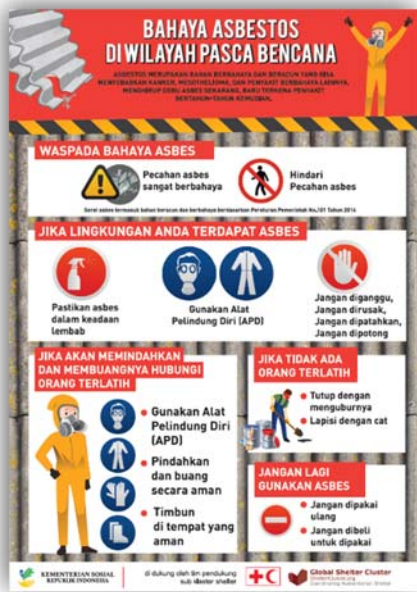
Picture 4. Asbestos Risk Reduction poster in post-disaster area

The MOSA issued asbestos hazard guidelines in post-disaster area that consist of steps that need to be taken to reduce the risk of asbestos exposure.