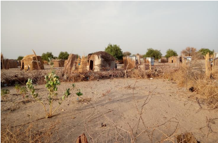
Abris d'urgence au Lac Tchad

CCCM CLUSTER Appuie les communautés déplacées