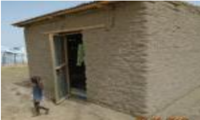
Photo d'un abri semi-durable dans le site de Kousseri