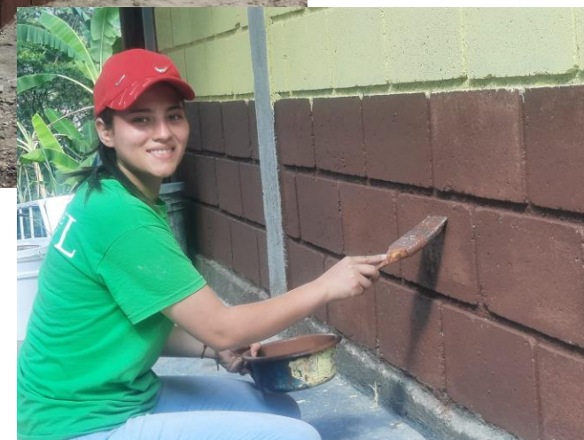
Talgua, Lempira.