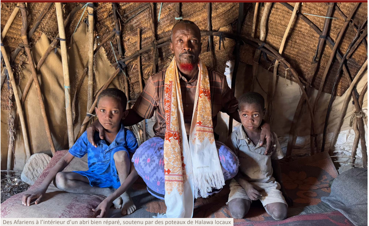
Des Afariens à l'intérieur d'un abri bien réparé, soutenu par des poteaux de Halawa locaux