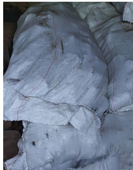
Малюнок 4. Брикети в зернових мішках.