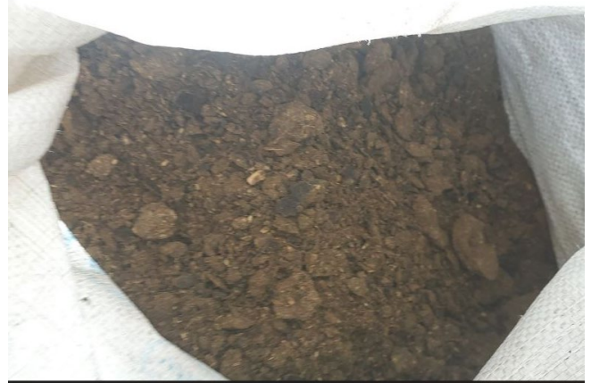
Малюнок 5. Брикети, пошкоджені під час розвантаження.

Партнер роздавав брикети в різних типах упаковки та об'ємах, включаючи мішки для зерна. В