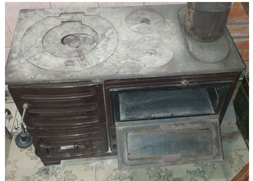
Малюнок 2. Товстостінні печі для палива з високою теплоемністю.

Більшість домогосподарств громади підключені до центральної мережі газопостачання, яку було відновлено. Однак деякі домогосподарства відключилися від газової мережі з власного бажання. Вартість повторного підключення оцінюється приблизно в 20 доларів США.