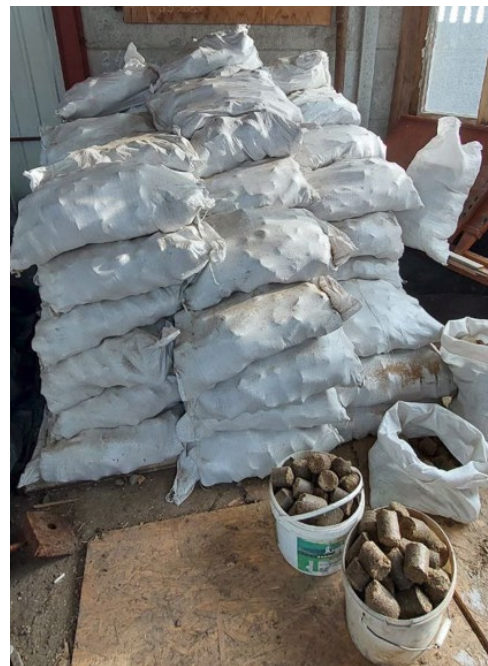
Малюнок 3. Різні фасування брикетів від одного партнера.

Відбір та верифікація бенефіціарів для отримання допомоги на тверде паливо здійснювалися ГО "Добрі справи" на основі списків, наданих місцевою адміністрацією, які оновлюються кожні три місяці. Між сторонами було підписано Меморандум про