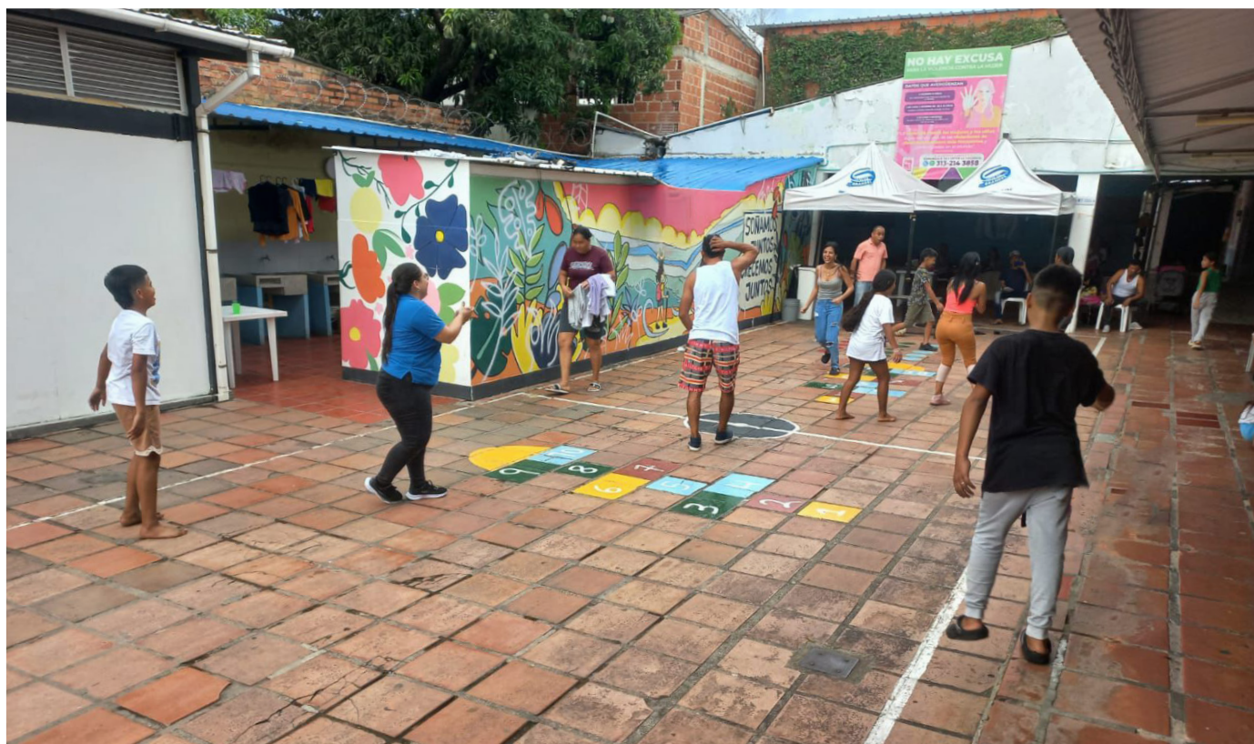
FOTO: RESPUESTA HUMANITARIA EMERGENCIA CATATUMBO EN EL ALBERGUE CATM, NORTE DE SANTANDER

Se coordinará con los socios del ELC para desarrollar la estrategia de atención sectorial. Además, se brindará apoyo técnico a las autoridades locales en la respuesta sectorial, incluyendo alojamiento temporal, transporte humanitario y suministro de artículos domésticos esenciales. Esta labor se llevará a cabo en conjunto con actores clave como la Secretaría de Posconflicto, el Instituto Colombiano de Bienestar Familiar (ICBF), la UNGRD, entre otros.