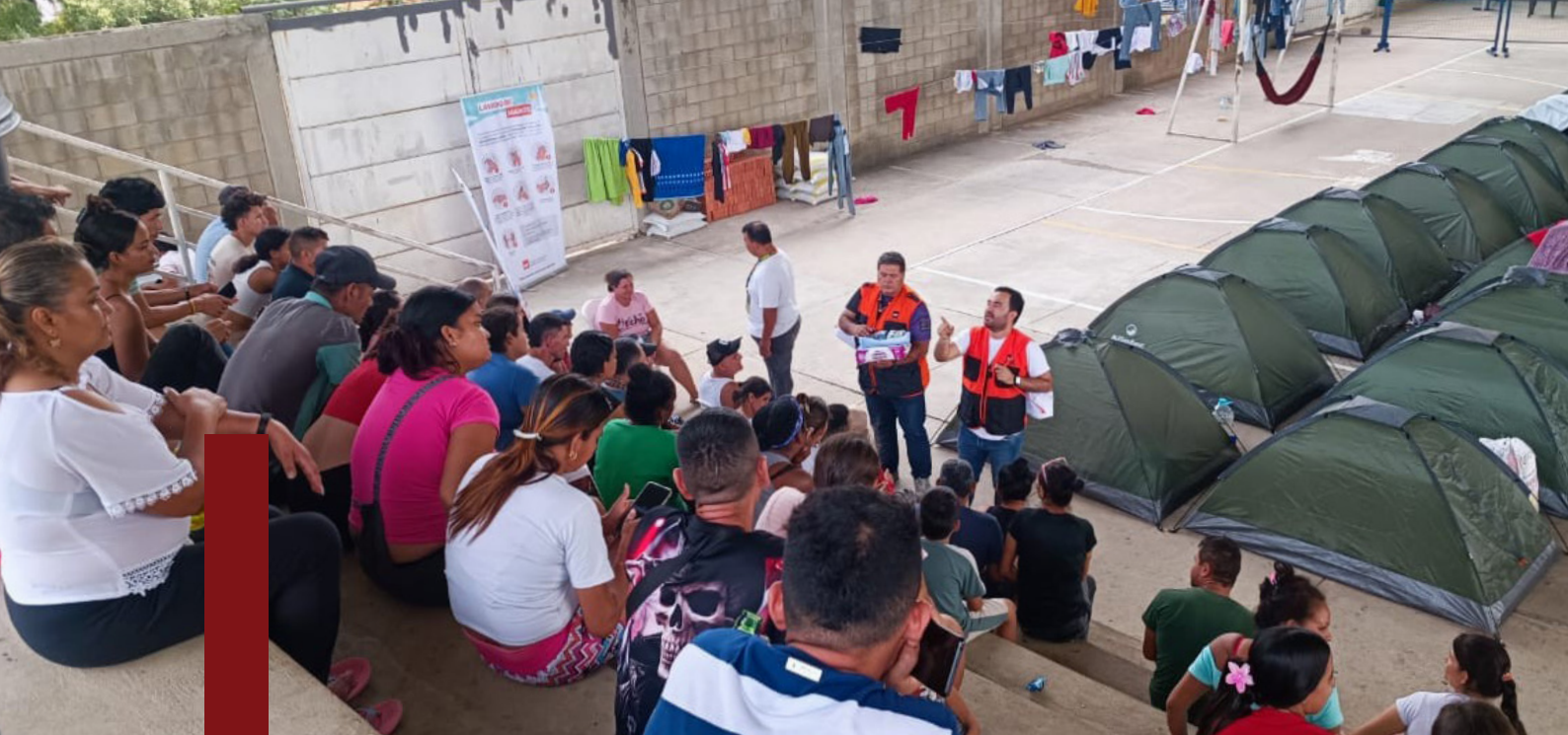
FOTO: RESPUESTA HUMANITARIA EMERGENCIA CATATUMBO EN CIC EL TRIGAL, NORTE DE SANTANDER / NRC COLOMBIA