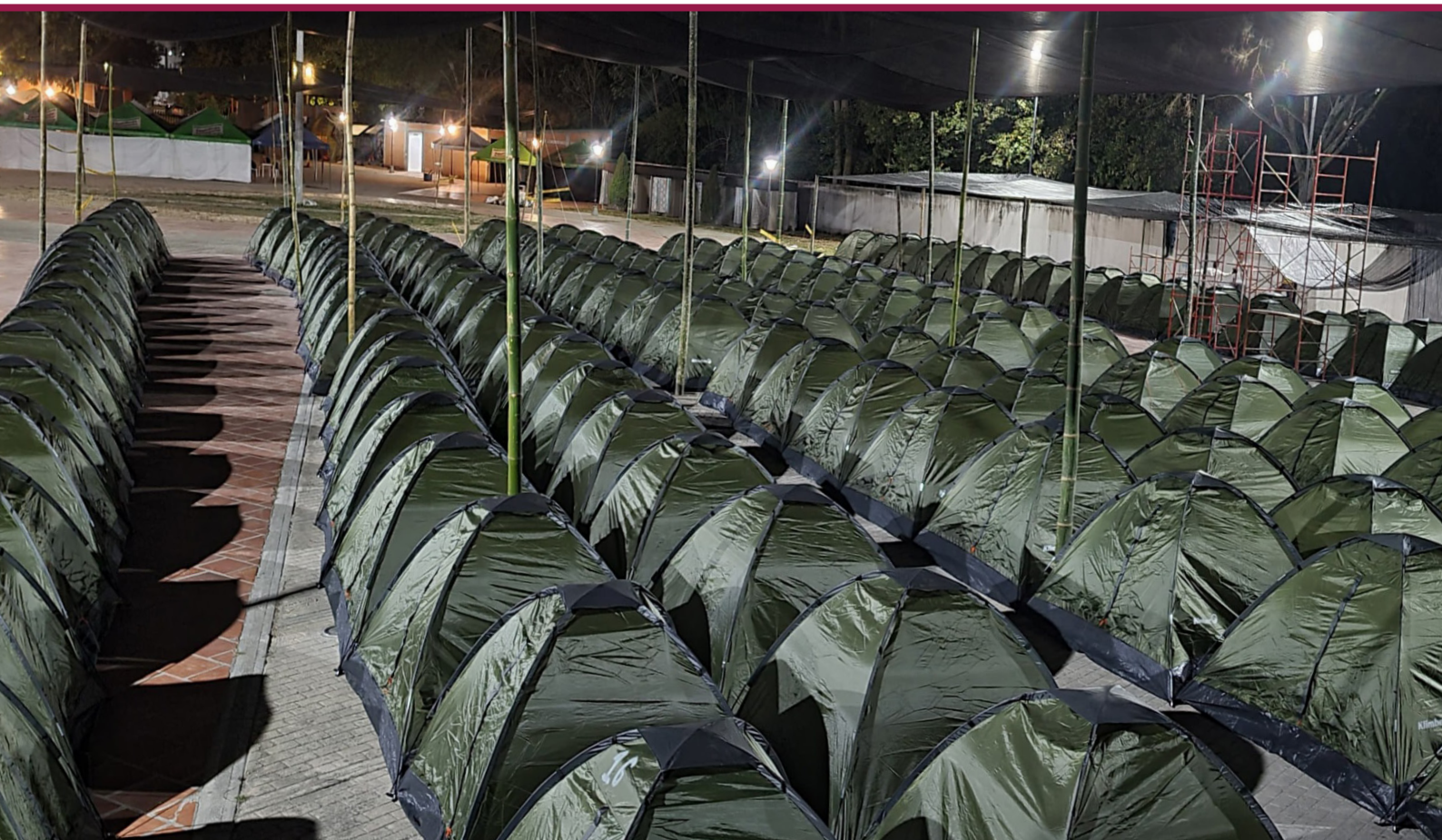
RESPUESTA HUMANITARIA EMERGENCIA CATATUMBO EN PLAZA DE FERIAS DE OCAÑA, NORTE DE SANTANDER