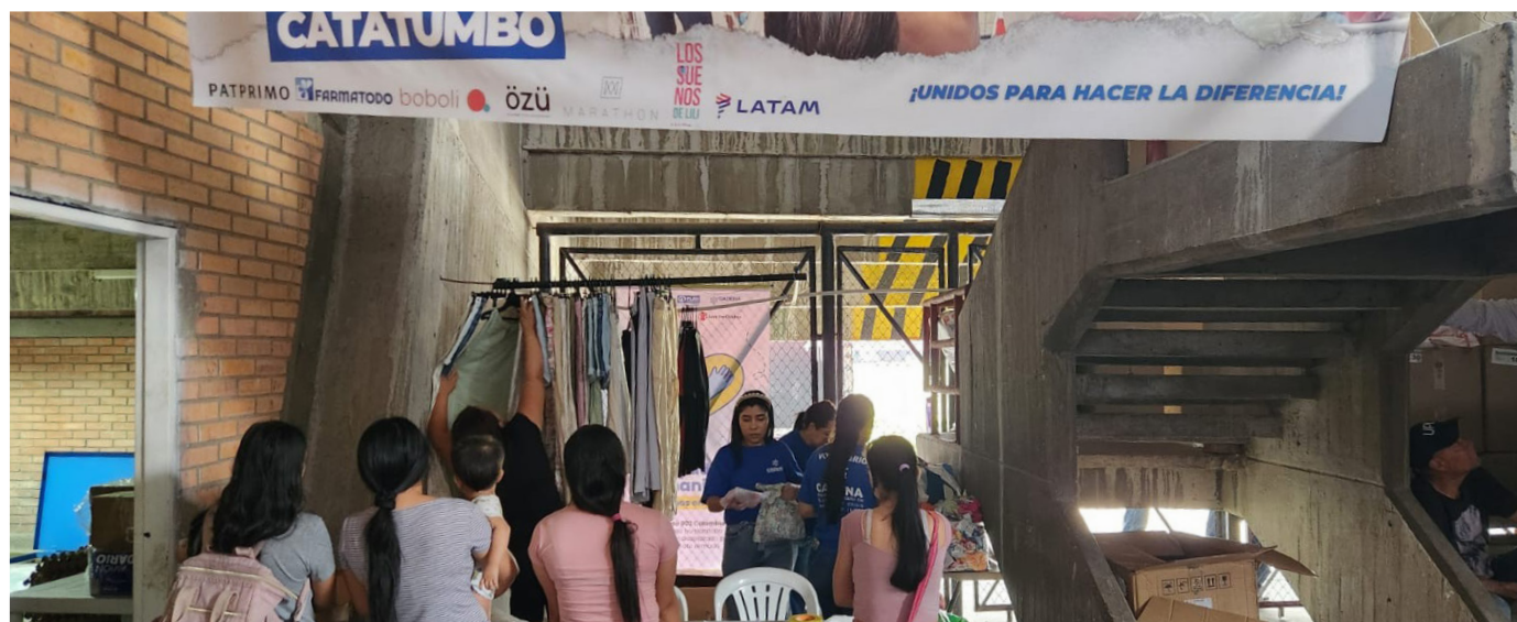
FOTO: RESPUESTA HUMANITARIA EMERGENCIA CATATUMBO DURANTE DISTRIBUCIONES EN ESTADIO, NORTE DE SANTANDER / CADENA COLOMBIA