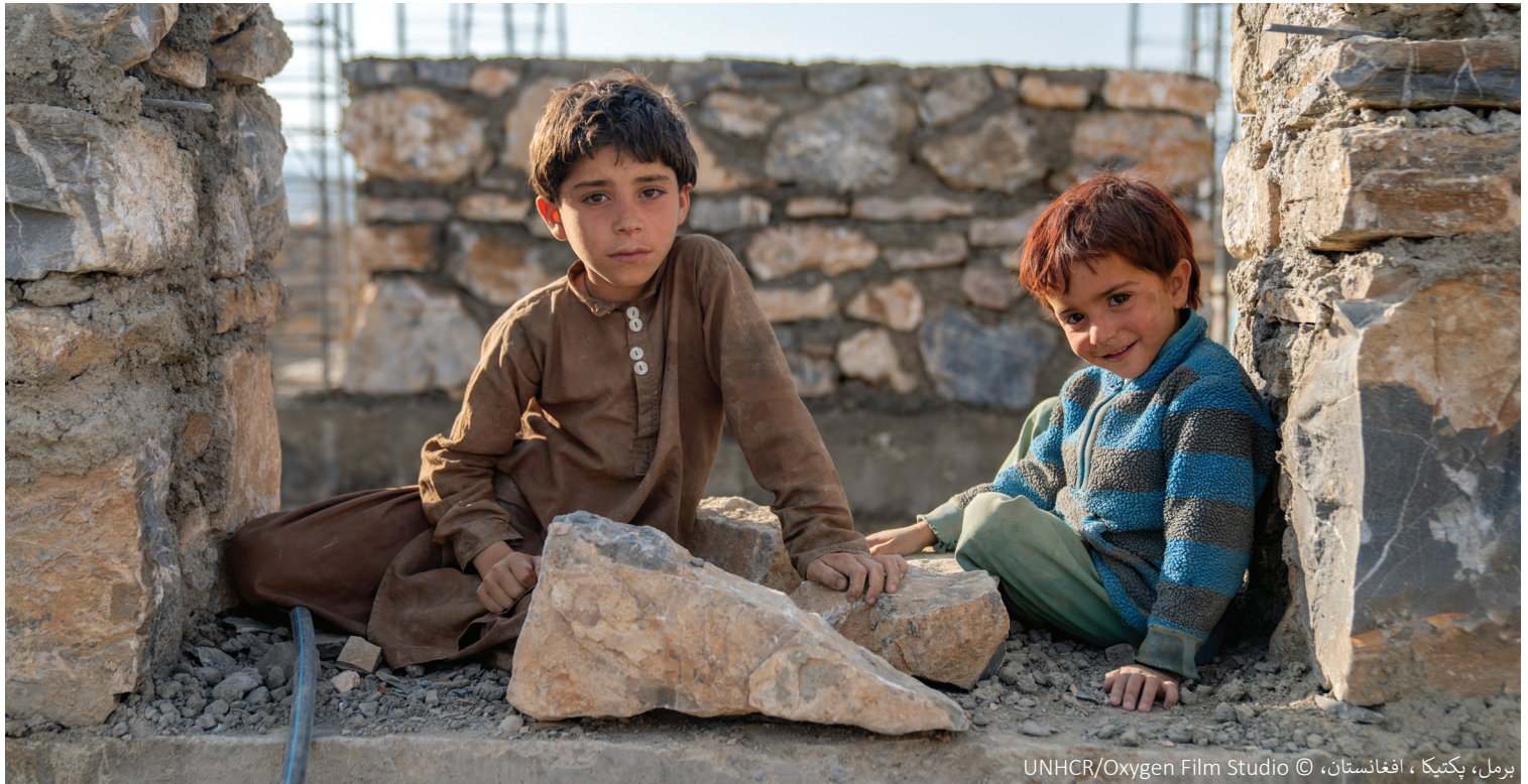
برمل، پکتیکا، افغانستان، © UNHCR/Oxygen Film Studio