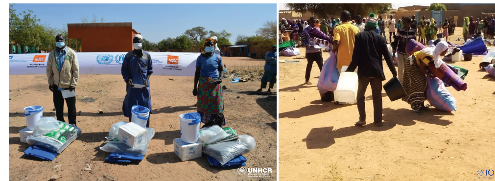
Distribution de kits AME à Pissila au profit de 507 ménages